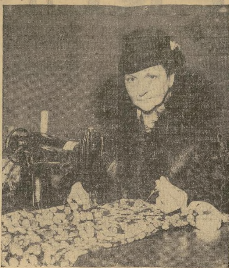
La secretaria del Trabajo, Sra. Frances Perkins, contribuye a la propaganda en favor de la etiqueta de los 20 millones de la venta durante la primavera.