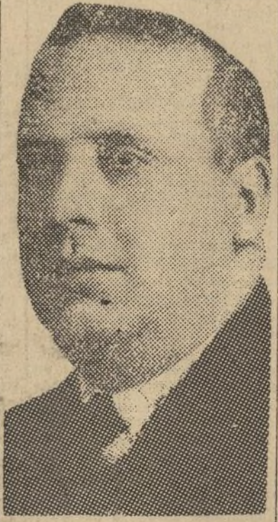
Sr. Indalecio Prieto

Refrirándose al reciente discurso pronunciado por el señor Martínez Barrio, en que éste dijo que Lerroux se sucedería a sí mismo en el caso de crisis, manifestó que las derechas habrían de manifestar su opinión sobre el gobierno.