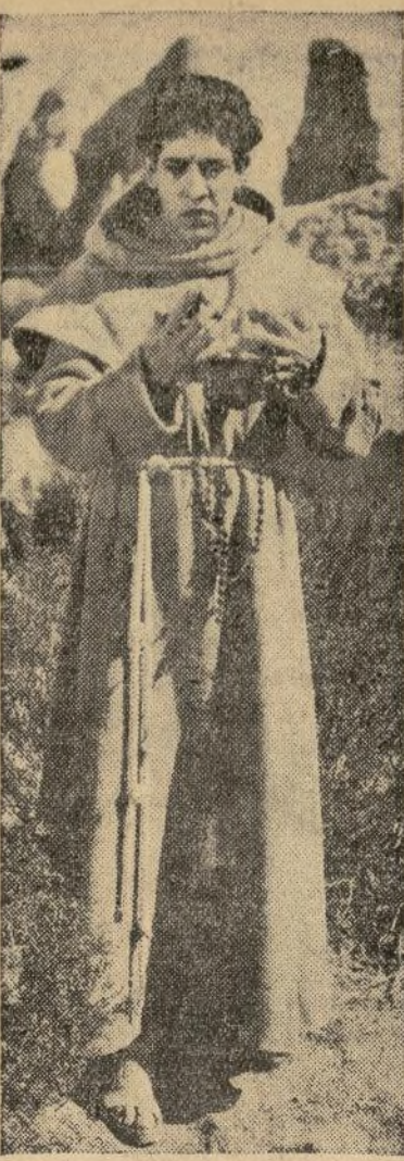
Actor y cantante, José Mojica se presenta en el "Varietades" como un misionero en "La Cruz y la Espada", estupenda producción cinematográfica ahora en rotación en el popular coliseo.