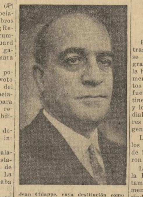
Jean Chiappe, cuya destitución como Prefecto General de la Policía de París, por Daladier, ha contribuido a crear la delicada situación actual.

RIO DE JANEIRO, febrero 6. (P) — El ministro de Hacienda anunció hoy que el presidente de la República, doctor Getulio Vargas, firmó ayer un decreto que declara efectivo el plan cuadrinacional del ministro de Hacienda, señor Osvaldo Aranha, mediante el cual se facilitará la reanudación del servicio sobre la deuda nacional, la de los estados y la municipal.