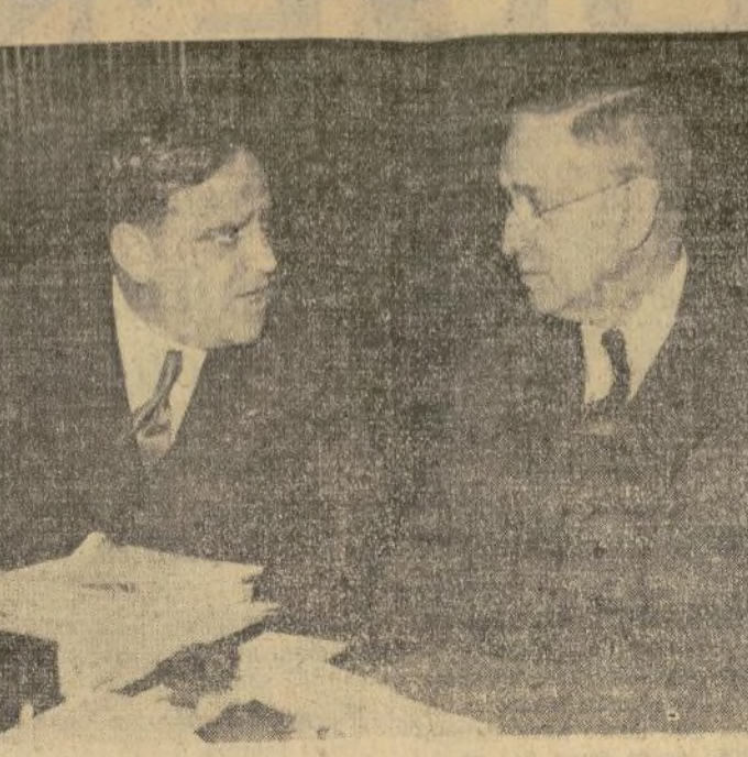
El alcalde de Nueva York, Fiorello H. La Guardia, durante su conferencia con el secretario Ickes, en Washington, recibió la promesa de que muy en breve se le concederá un crédito de $68,000,000 de los fondos de la Administración de Obras Públicas, para los proyectos de esta ciudad.