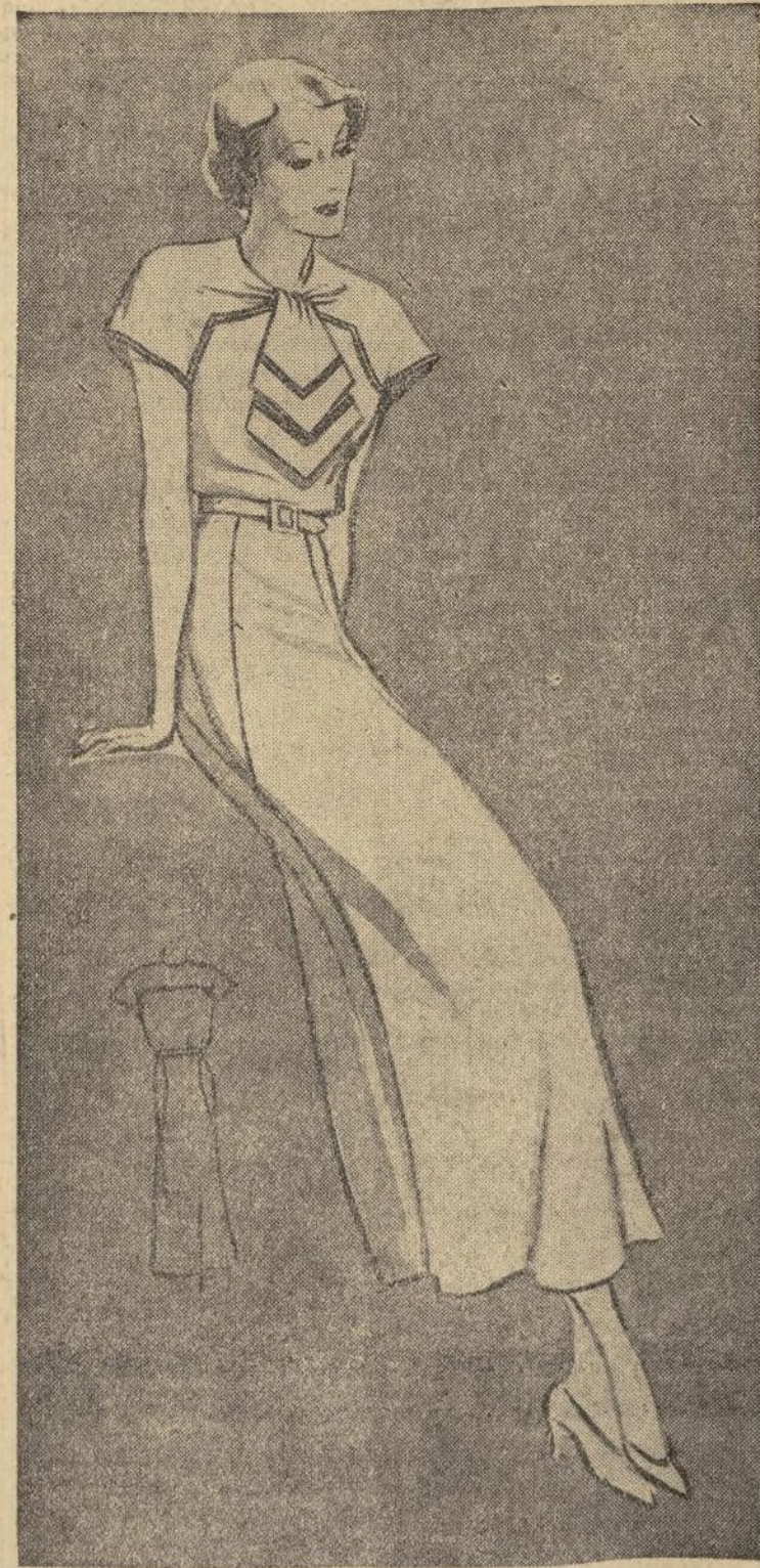
No. 1239-B VESTIDO MUY PRÁCTICO

1239-B.—Nuestro patrón de hoy es un vestido muy práctico para usar durante los días calurosos del verano. Lo hemos podido admirar en las colecciones de modelos que se han lucido en Palm Beach. Toda mujer americana elegante, se encuentra lista para el verano si prepara su armario con varios de estos vestidos de diario. Es muy cómodo por lo libre que deja el cuerpo para cualquier movimiento o ejercicio que se quiera hacer mientras se usa. Puede hacerse en cualquiera de las nuevas telas de algodón que hay en el mercado, como piqué, gingham, hilo, o paño fino. Este patrón viene cortado en los tamaños 34, 36, 38, 40 y 42. El tamaño 34 usará 4 y un cuarto yardas de material con un ancho de 35 pulgadas y 5 yardas de 1 y media pulgada de ancho de biés para adornar el vestido.