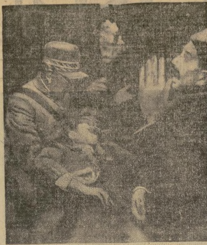
Un testigo tomó esta fotografía al caer herido de muerte Mohammed Nadir Shah, rey de Afganistán, en brazos de uno de los miembros de su séquito, en Kabul, mientras dirigía la palabra a un grupo de estudiantes.

Confisca en Viena el gobierno miles de grandes bombas