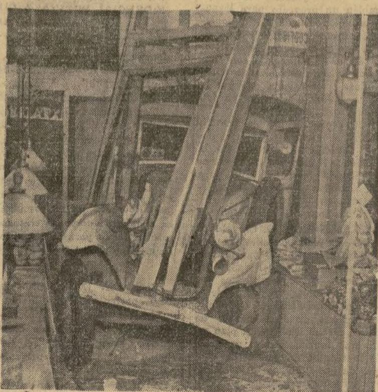
Camión empotrado en la fachada de un establecimiento de Cleveland que, al resbalar en la calle, se precipitó en la tienda matando a un muchacho que había ido a comprar la cena para su familia.