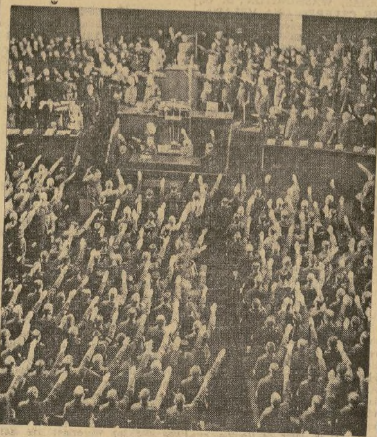
Adolfo Hitler recibiendo el saludo nazista en el Reichstag en el primer aniversario de su encumbramiento a la Cancillería.