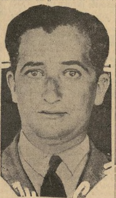
Comandante Ramón Franco

El aviador español, comandante Ramón Franco, que desde aquí y por la vía aérea partió hace varias semanas hacia Cuba y Méjico en misión del gobierno de Madrid,