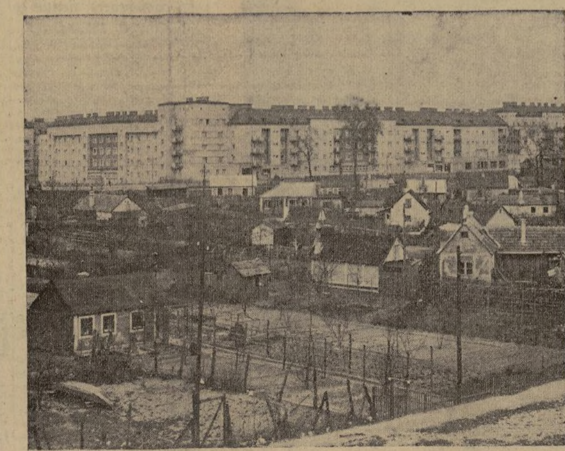
Uno de los edificios municipales de apartamentos en Viena, construido durante el régimen socialista que ha sido blanco de la artillería austriaca para desalojar a los obreros rebeldes que se defendían con ametralladoras y granadas de mano. Dicese que los pisos superiores quedaron totalmente destruidos enterrando sin distinción bajo sus ruinas a mujeres, niños y defensores.