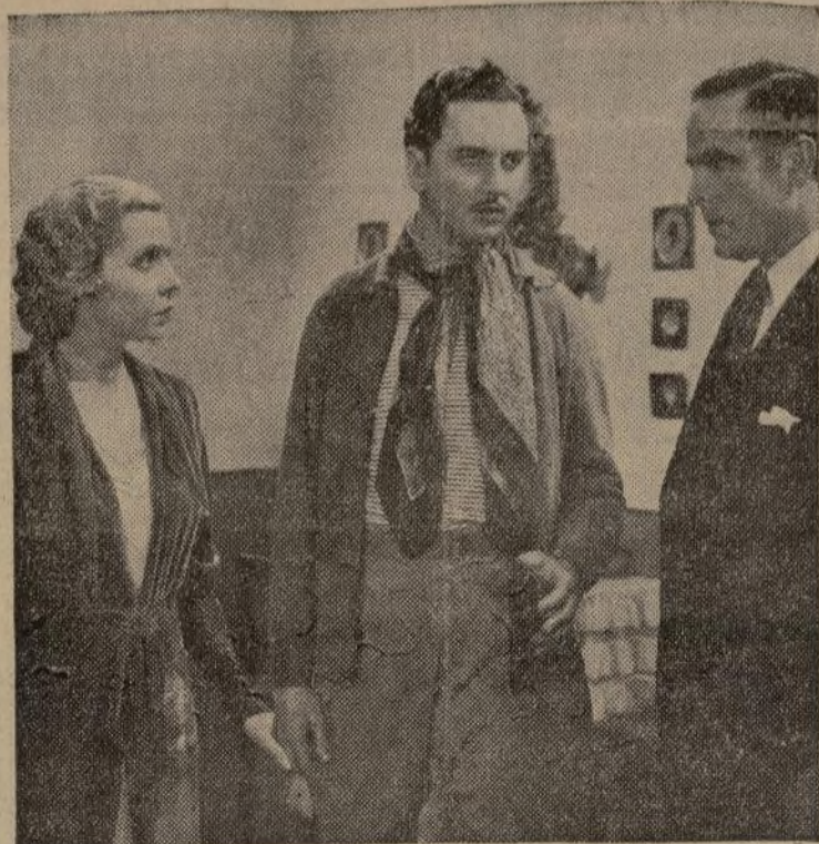
La gran Catalina Bárcena, destinada a ser una verdadera estrella en la constelación cinematográfica frente a un astro que se apaga: Antonio Moreno, —aquel que cuando niño nos electrificaba— en una escena de "Primavera en Otoño" ahora en rodaje en el Teatro Variedades.