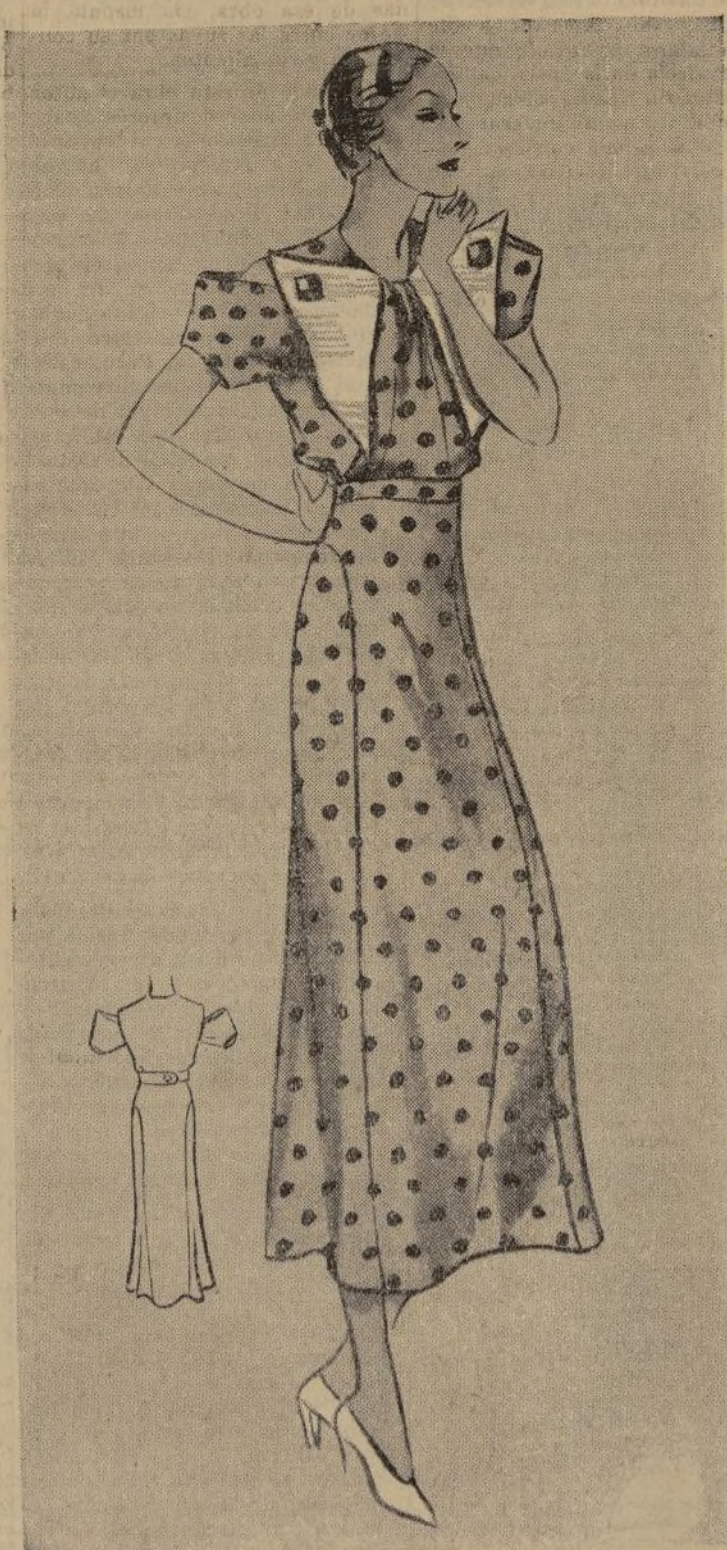
VESTIDO DE MAÑANA PARA VERANO

1247 B. — Una de las ideas de esta mujer debe tener presente es el pensar en el día de mañana. Si hacen eso, siempre con tiempo mirarán sus necesidades para la tempestad venidera, y cuando ésta llegue no estarán apuradas y tendrán sus armarios bien provistos de todas sus necesidades.