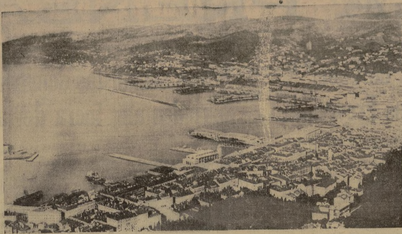
Trieste, famoso puerto del Adriático en donde, según noticias, Italia está concentrando tropas en previsión de que los sucesos de Austria empeoren. También se dice que Italia ha movido varios regimientos a Padua y Bolzano, esta última ciudad cercana a la frontera.