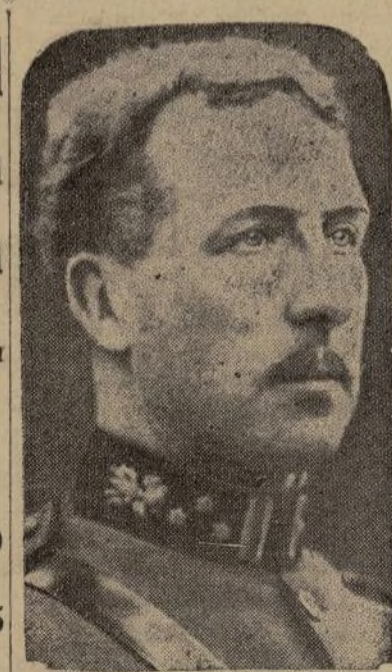
El finado Rey Alberto

Todavía queda por conocerse la versión de la acusada.