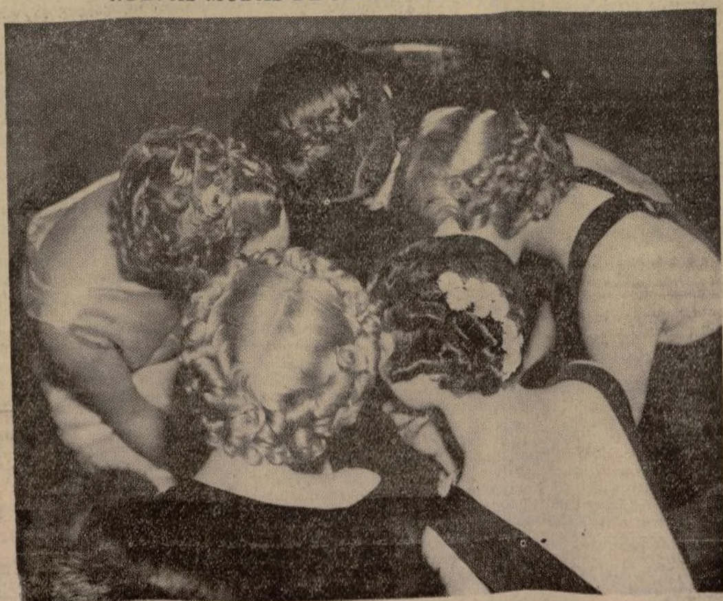
Custro de las modelos que exhibieron las modas de peinados en la Exposición celebrada por los peluqueros del Estado de Nueva York, en el Hotel Commodore.