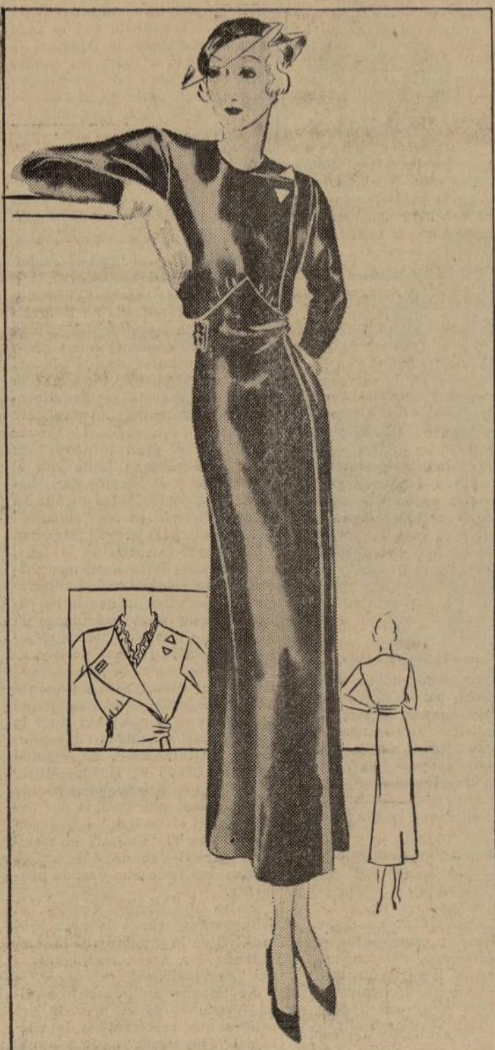
VESTIDO IMITANDO ABRIGO

1250-B. — Elegancia en extremo hay en cada línea de este vestido imitando también un abrigo, muy propio para la primavera. Para la dama que le gusta usar trajes que puedan cambiarse, este modelo es ideal. La parte de enfrente puede usarse cerrada, y al querer que aparezca como abrigo o chaqueta se desabrocha, y aparece completamente diferente, pudiéndose poner en el escote y las mangas, rizados, ya bien de taffeta o cualquier material propio para este objeto, y también se puede adornar con cuello y puños de organdi, pié, o batista bordada los cuales son muy prácticos para poderse cambiar con frecuencia.