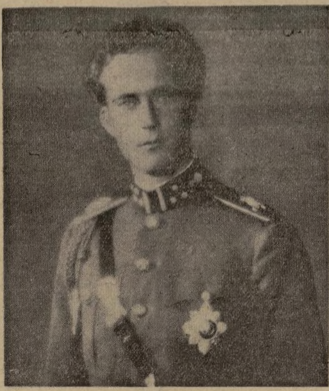
El príncipe heredero Leopoldo de Bélgica, hijo del Rey Alberto que, por la Gracia de Dios y la voluntad del pueblo sucede a su augusto padre en el trono de dicho país.