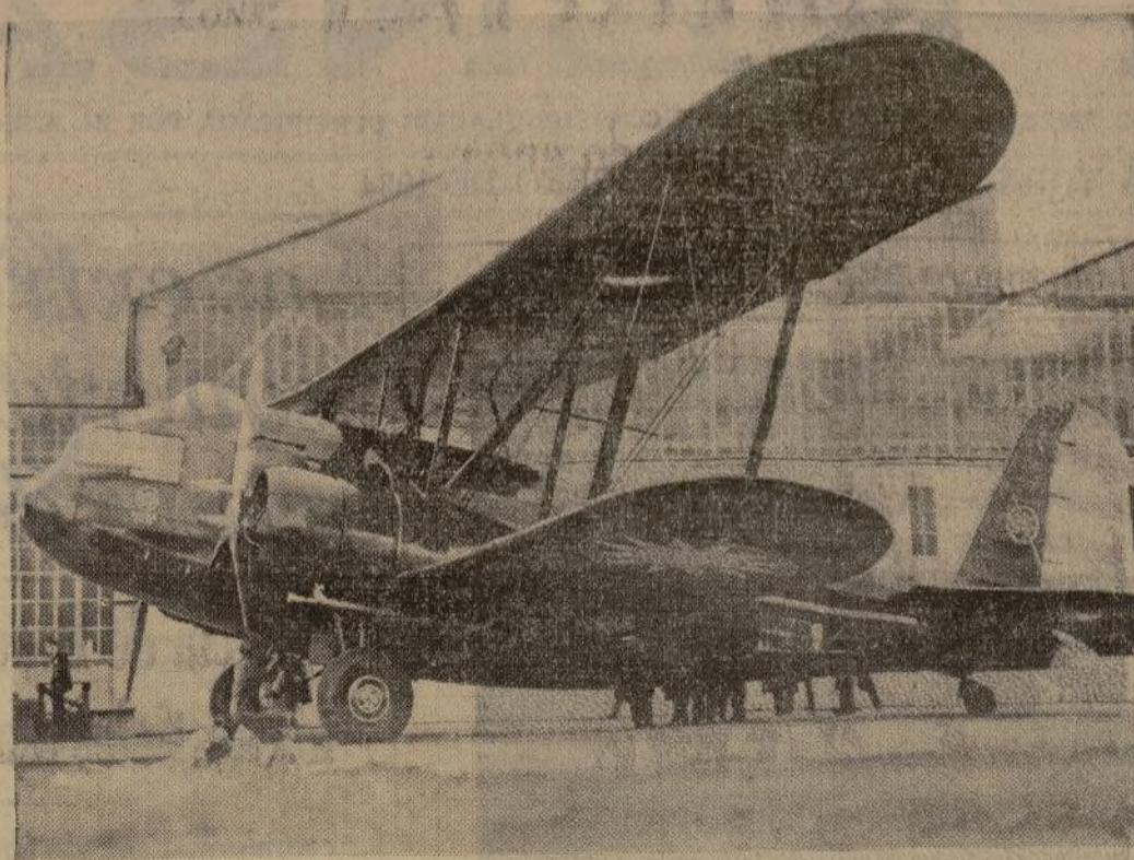
Aeroplano de bombardeo que el capitán Frank Hawks llevará a China en donde lo exhibirá ante las autoridades del gobierno. Después el famoso aviador volará a los estudiantes del antiguo imperio celeste.