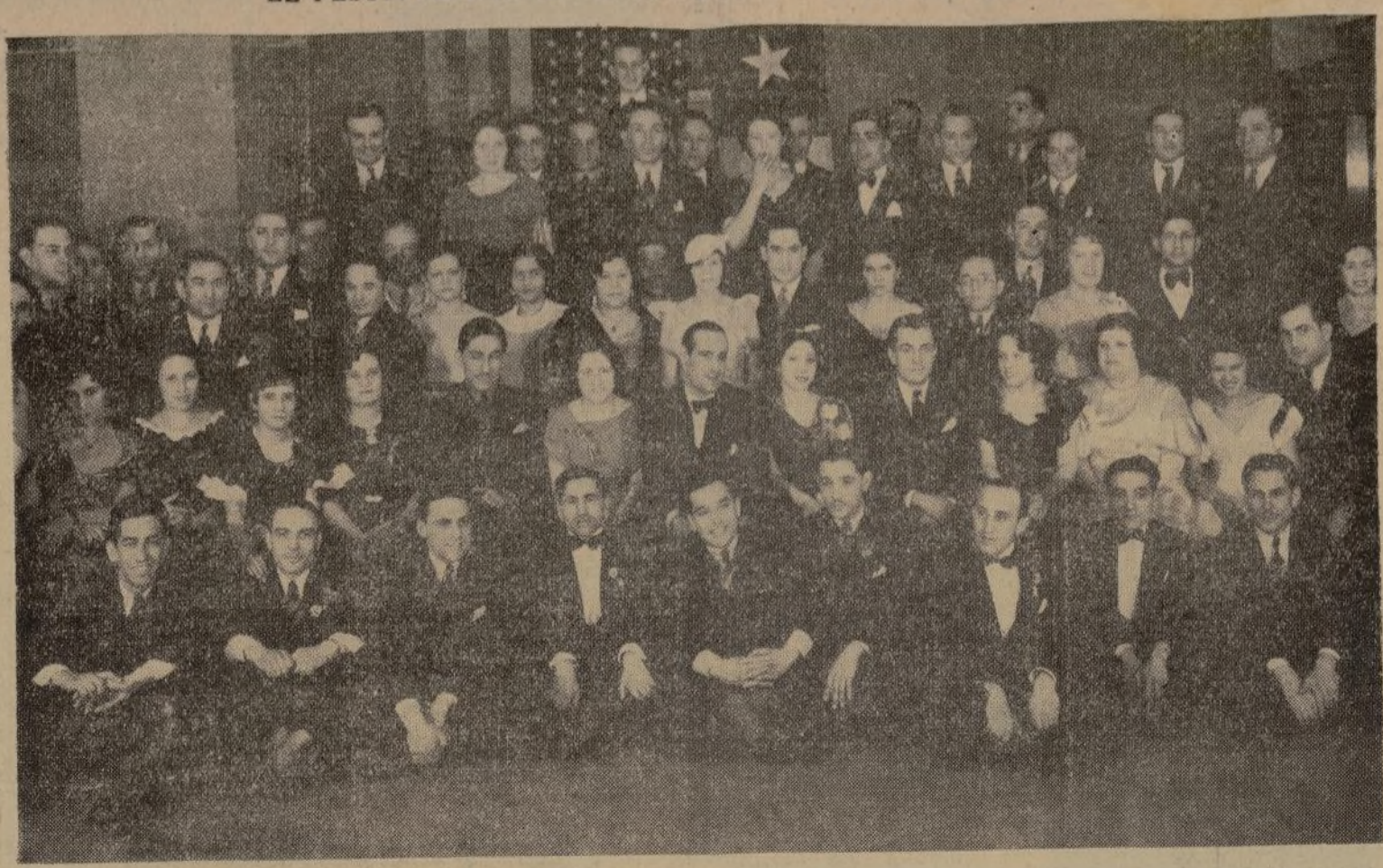
Al baile celebrado por esta agrupación chilena, anteanoche en el Roerich Hall, acudió una lucida concurrencia, parte de la cual figura en esta fotografía. El comité organizador hizo cuanto estuvo a su alcance para que los asistentes disfrutaran horas agradables, y la velada con gran animación, se prolongó hasta las dos de la madrugada.