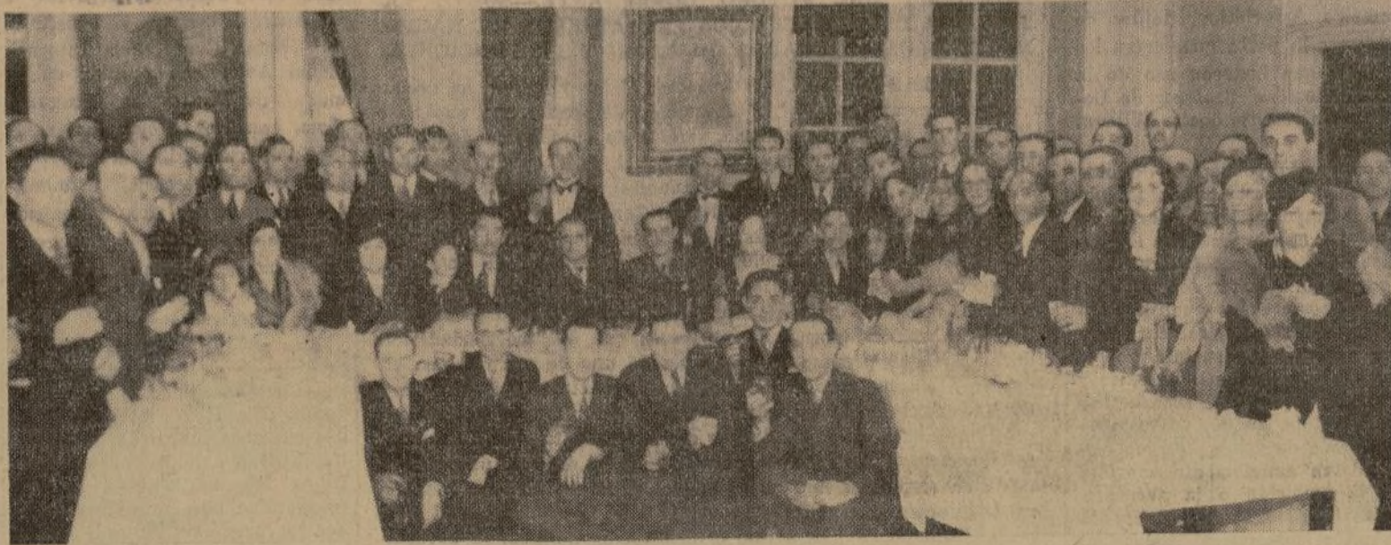
Participantes en el "buffet" que, en honor del conocido "as" de la aviación internacional, comandante Ramón Franco, dió anteanoche en el Centro de Galicia, una vez terminada la representación teatral de la Compañía Nadal Santa Coloma, en el Teatro Cervantes. El acto constituyó una prueba de la enorme simpatía que goza este heroico aviador, que conquistó inmarcesible gloria para España.

EL COMANDANTE RAMÓN FRANCO HOMENAJEADO EN EL CENTRO DE GALICIA