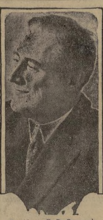
Presidente F. D. Roosevelt