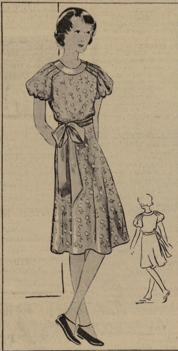
No. 1260B VESTIDO DE PRIMAVERA PARA NIÑA

1260-B. — El gracioso vestido diseñado hoy, da una idea a las madres de lo que pueden necesitar sus hijas en la primavera y principio de verano.