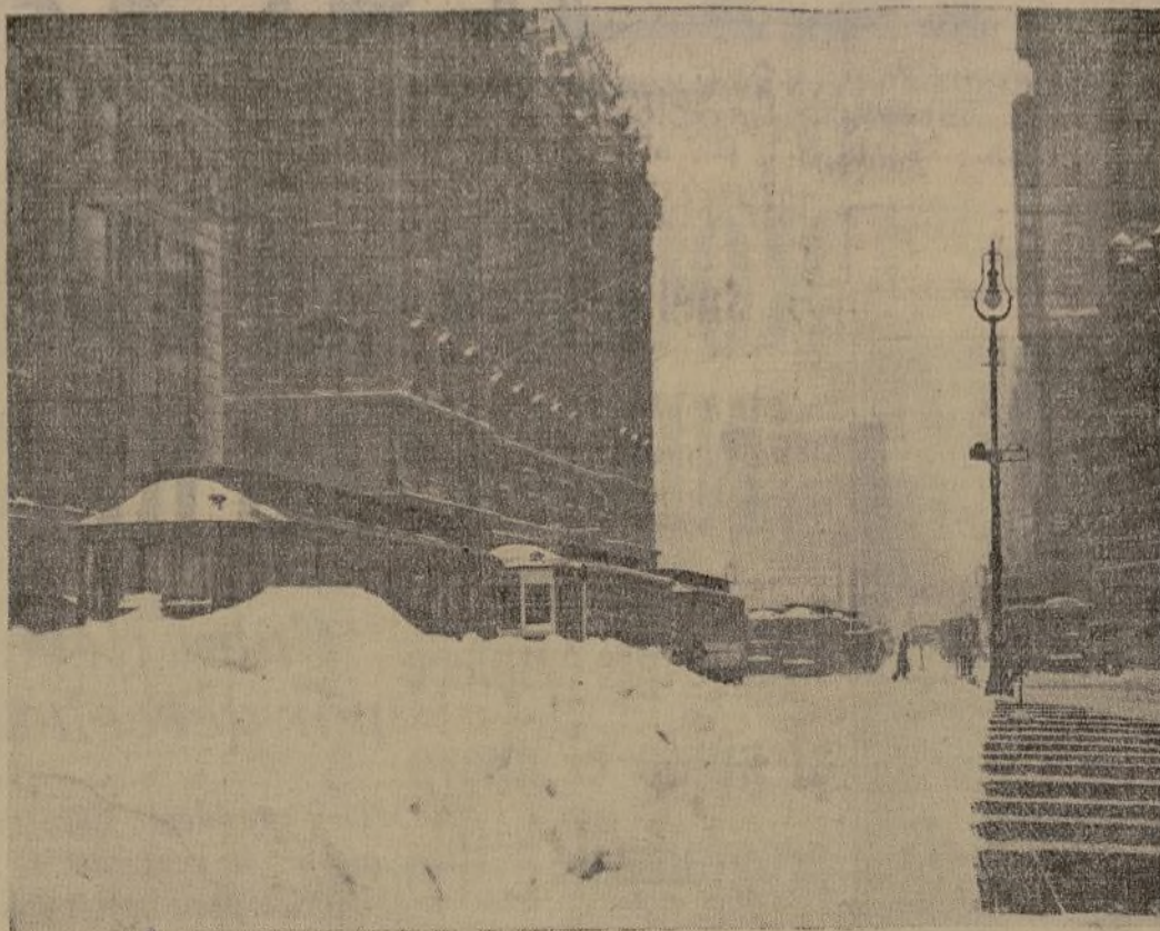
La desaparición de los trabajadores de la CWA que llamó el municipio para que ayudaran a limpiar las vías públicas, ha motivado la continuación en las calles, por varios días, de grandes montones de nieve.