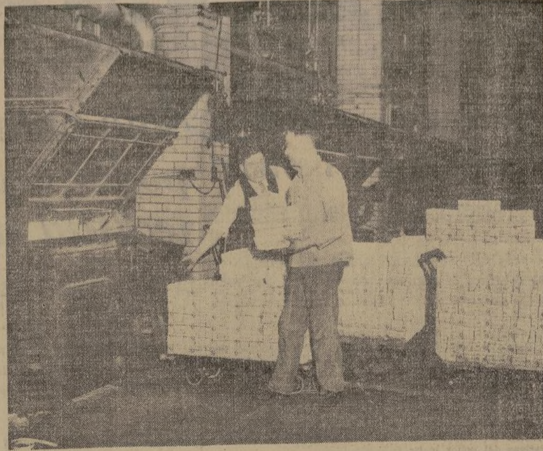
Los fogoneros del edificio que ocupa un banco de Filadelfia, destruyendo más de un millón de billetes provisionales impresos por las instituciones bancarias cuando estas fueron clausuradas hace un año. Otros muchos bancos están limpiando sus cajas fuertes de este dinero inservible.