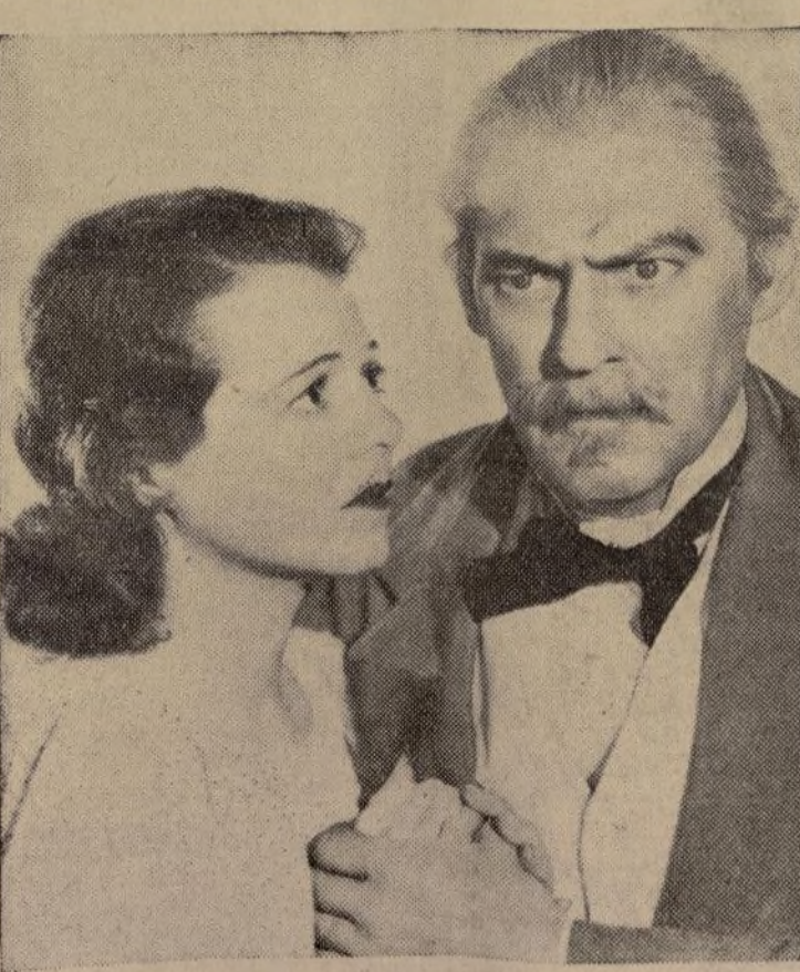
Algo así parece decir Lionel Barrymore a la bella Janet Gaynor en esta escena de "Carolina" que se presenta en los teatros Regent y Hamilton hasta el martes.