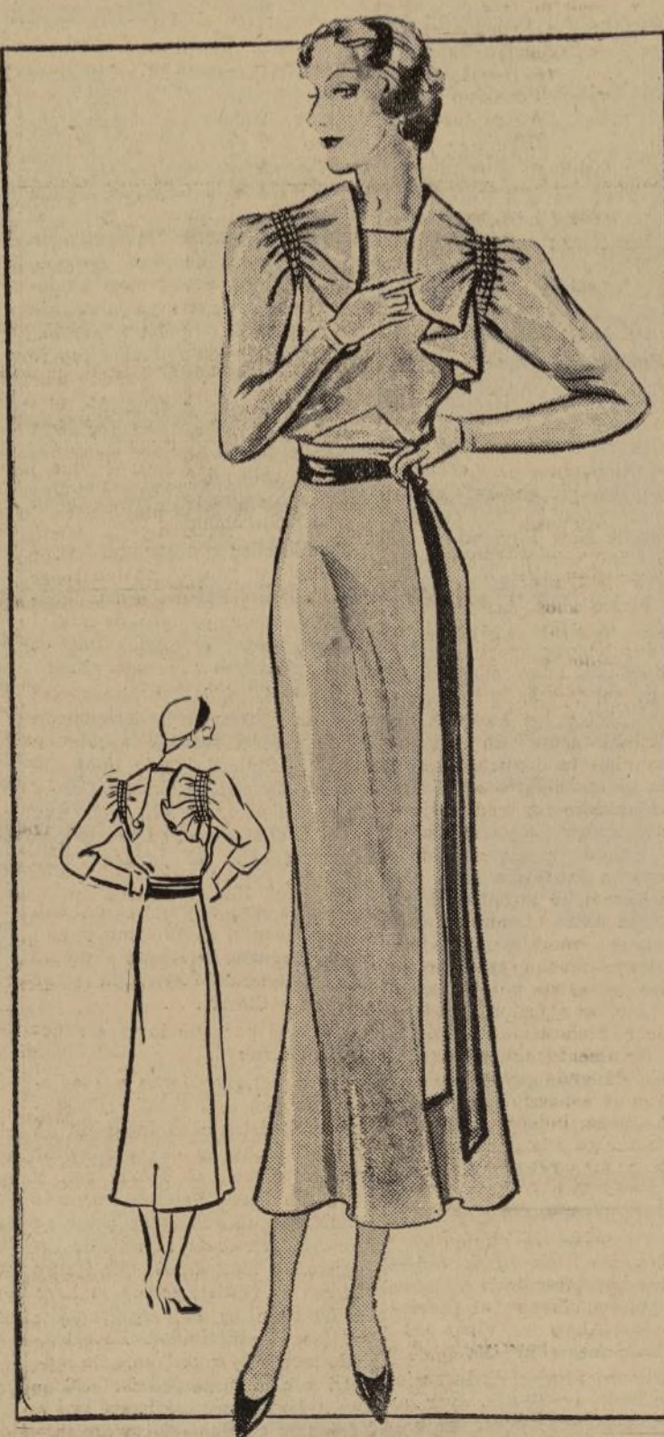
VESTIDO DE TARDE

1261-B. — Una importante noticia para la colección de vestidos de tarde y la primera etapa del verano, se nos informa de algo nuevo y muy gracioso en los modelos y adornando el cuello. Estos, rizados que caen suavemente. Es algo que es muy bien recibido y admitido por las damas que no han estado satisfechas con la moda pasada, pues en ésta, encuentran algo que les favorece la silueta, y lo cual nunca había aparecido entre nuestras modas. Este modelo está hecho en tafeta, material que después de haber estado sirviendo sólo para lazos y bufandas sueltas, ha hecho de nuevo su entrada en nuestros armarios. En este caso particular,