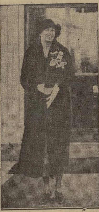
Mrs. Franklin D. Roosevelt

Durante las semanas que ha pasado en Nueva York, el célebre piloto del "Plus Ultra" ha recibido señalados agasajos de sus compatriotas y, especialmente, de la colonia gallega con la cual fraternizó el bizarro aviador plenamente.