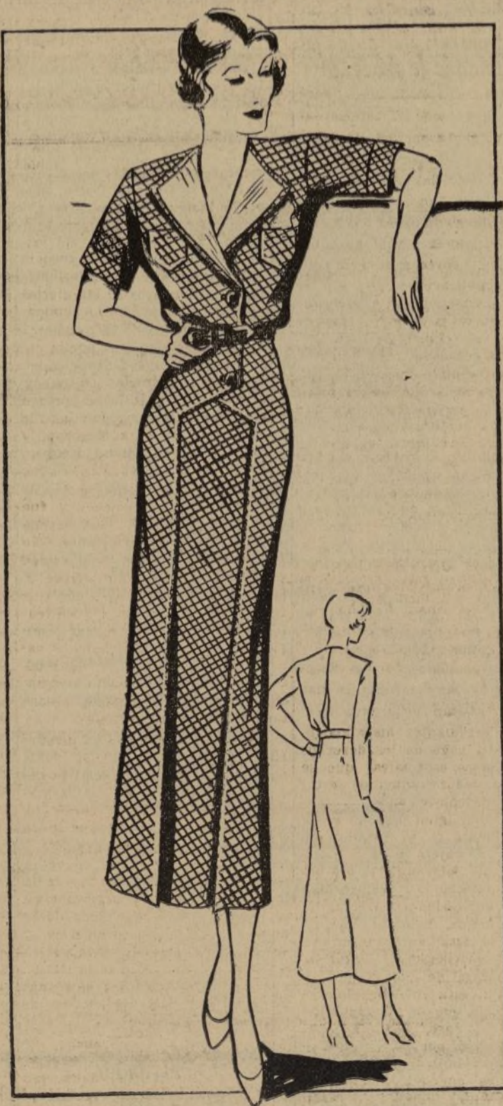
ELEGANTE VESTIDO DE CASA

1262-B.—El vestido diseñado hoy da una idea del gusto que tienen los creadores de la moda para saber dar elegancia y distinción a lo que se ha de usar en la casa. Las dueñas de casa han realizado que los trajes bien cortados y con su tinte elegante no tienen que estar aparte de sus faenas diarias y por lo tanto siempre han de tener listos los de esta índole para usarlos en un caso dado en que estén trabajando en la limpieza, pero se presente alguna visitante y tengan que intervenir para preparar refrescos con que obsequiarlas, es muy cómodo tener a mano un vestido de esta categoría y que reúne las dos cualidades,