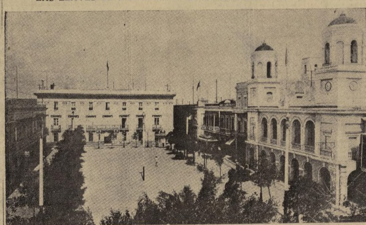
La Plaza "Baldorioty de Castro," (antigua Plaza de Armas) de San Juan de Puerto Rico. A la derecha, el Ayuntamiento donde se le hizo entrega a Mrs. Roosevelt de las llaves de la ciudad en recepción oficial. En el fondo, la vieja Intendencia, que fué residencia de la Hacienda Pública.

LAS LLAVES DE SAN JUAN A LA DISTINGUIDA VISITANTE