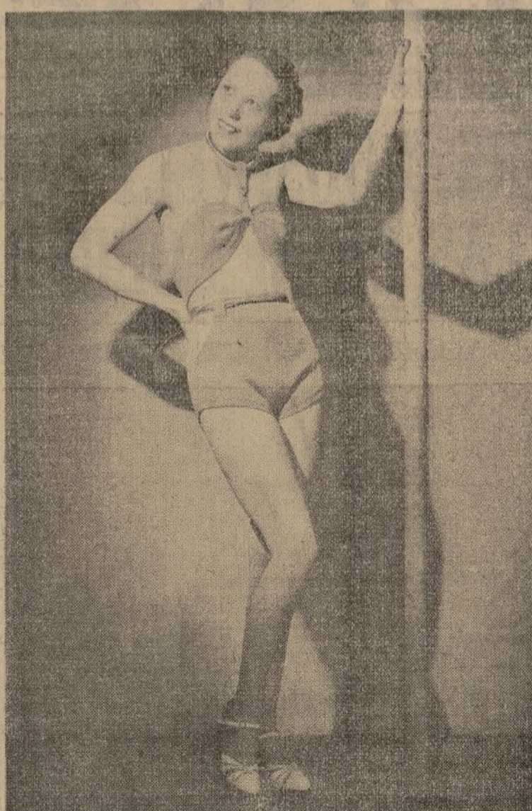
Traje de punto verde, que se compone de pantalones y un corpiño abreviado y sujeto al cuello por una argolla de metal, que ha llamado mucho la atención.