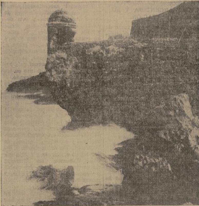
La histórica "Garita del Diablo," paraje legendario en el Campo del Morro, en San Juan de Puerto Rico, visitado el sábado por la señora Franklin D. Roosevelt y su comitiva en viaje de inspección a la isla.