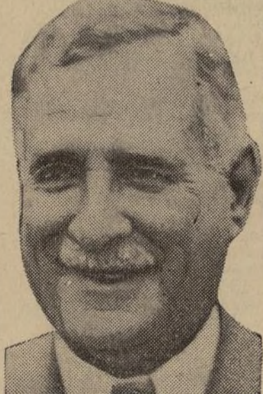
Presidente Carlos Mendieta