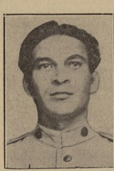
Coronel Fulgencio Batista

Los huelguistas ganaron la primera jornada a las uniones obreras rompiendo sin el ingreso todos los paros en la Habana.