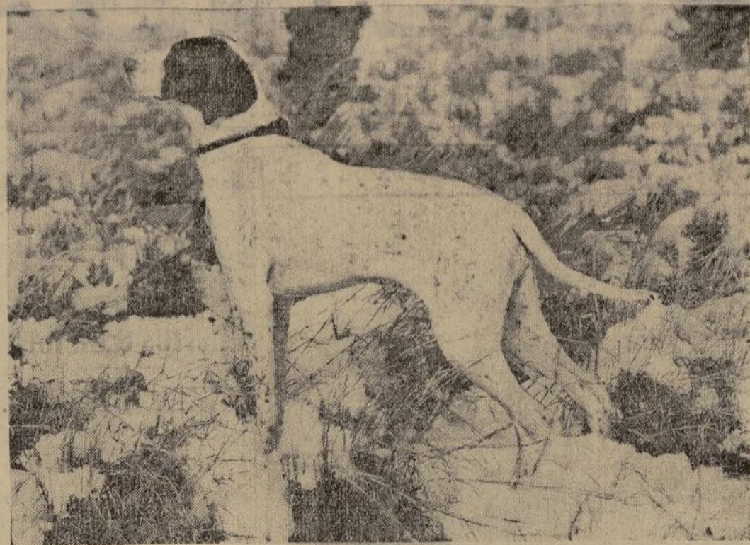
"Gene of Crombie" uno de los perros presentados que más ha llamado la atención en las pruebas primaverales verificadas en Happpage, Long Island, bajo los auspicios del Club de Cazadores de dicha población.