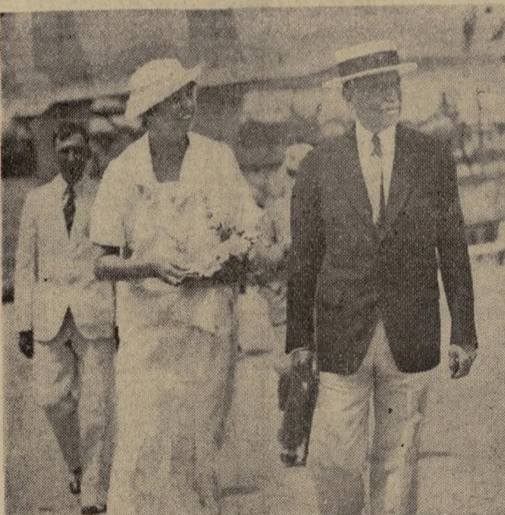
El gobernador de Puerto Rico, Blanton Winship, da la bienvenida a la esposa del presidente, a su llegada a San Juan, por aeroplano, antes de visitar los barrios pobres de las cercanías de la capital borinqueña. El 82 por ciento de la población de Puerto Rico ha pedido ayuda a la Administración de Auxilios.