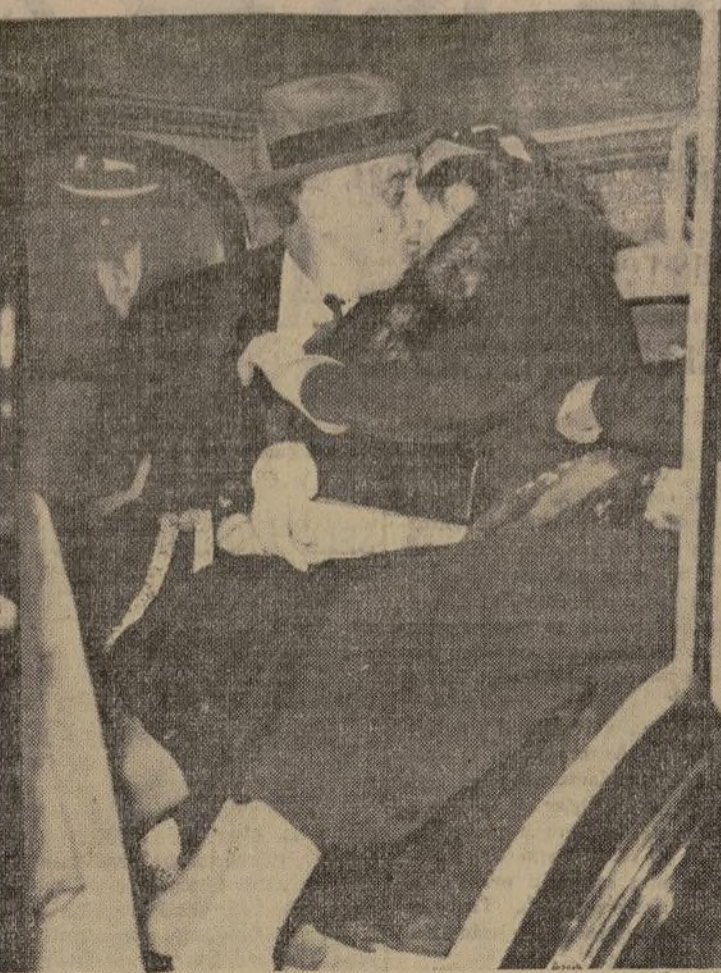
El presidente de los Estados Unidos dando la bienvenida a su esposa en la estación de la Unión, al regresar la ilustre dama de una excursión por las Antillas, el día que se cumplió el 29.º aniversario de su matrimonio.