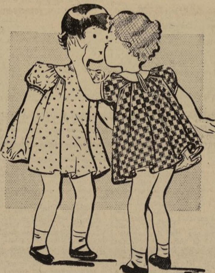
No. 1275-B DELICADO VESTIDO PARA NIÑA

1275-B.—Cualquier época del año es buena para estudiar los cambios que necesita el armario de los niños, pero sobre todo en el primer día de primavera se encuentra a toda madre que está pendiente de sus hijos, planeando el trousseau de sus pequeños para el período veraniego. Días de juego son los que se aproximan, y eso quiere decir gran abundancia y variedad de vestidos, hechos en materiales diferentes y alegres en colorido, para hacerlos atractivos en cualquier día y hora. El modelo del dibujo es especialmente diseñado para hacerse en algodón estampado, y colores sólidos. Muy sencillo de hacer y tiene unas cómodas y graciosas mangas abullonadas. En la parte de atrás, tiene la suficiente apertura para que se pueda quitar y poner con facilidad sin peligro de que se rompa.