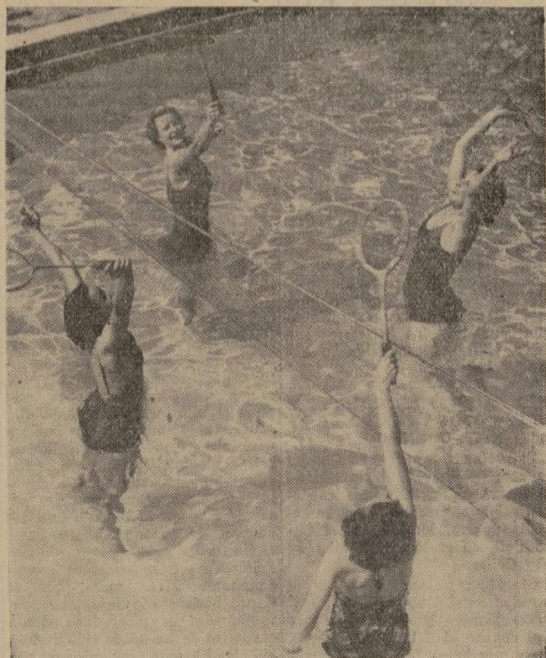
Muchachos de la Escuela Superior de Flintridge durante el primer juego de su clase, en la piscina Huntington, de Pasadena. La red está puesta a profundidad media lo que obliga a las jugadoras a nadar mientras le dan a la pelota.