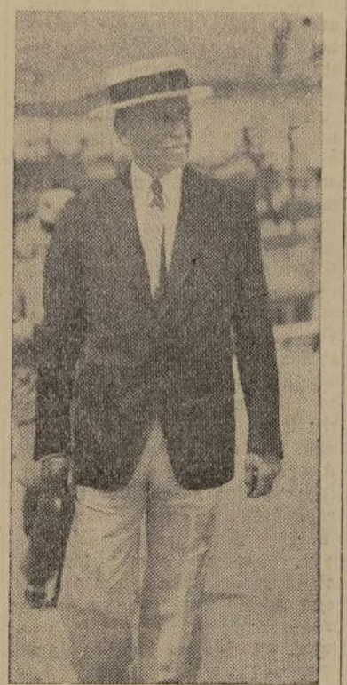
Gobernador Blanton Winship

(Continuación de la primera página) saje que fue dado a la publi- cación hoy, manifestando que su es- tudio, demasiado corto, dado a las condiciones económicas, tendrán por resultado medidas muy prác-