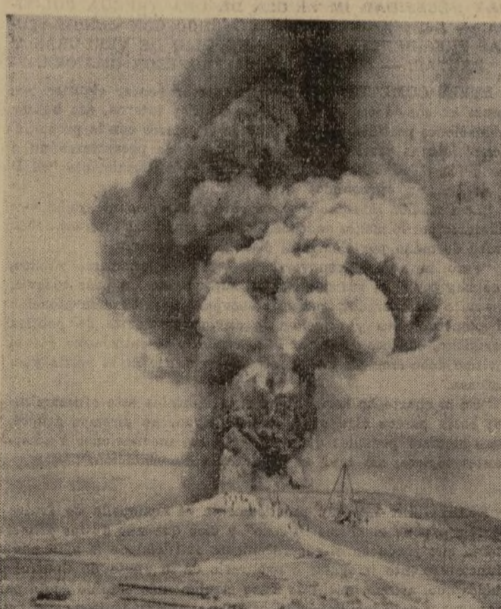
Las llamas y el humo se elevan en el aire a gran altura sobre las bajas colinas de las inmediaciones de Rabat, al incendiarse un pozo. Puede juzgarse de la altura de las llamas por las personas que se ven tratando de apagar el siniestro.