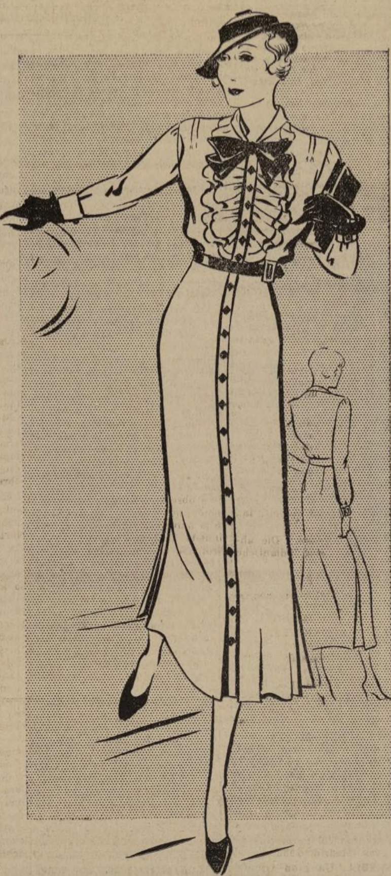
No. 1284-B VESTIDO CON BLUSA ESTILO CORPIO DE CAMISA

1284-B.—No hay nada que favorezca más y haga más gracia que las corbatas y chorreras rizadas en la parte de enfrente de las blusas. En el modelo que ofrecemos hoy se presenta esta moda muy graciosa en un vestido de diario. A la mujer elegante que le gusta tener muchos vestidos con que variar durante la temporada estival, se le debe aconsejar este tipo de traje, pues haciéndolo en materiales distintos y colocándole elizado en otra forma, lucen como si fueran copias diferentes y se encuentra perfectamente cómoda y atractiva. Los botones colocados de arriba abajo son solamente para adorno. El material es linón fino. Otros géneros también muy apropiados son el gingham, crepe de china o estampados. Generalmente los colores usados en esta clase de vestidos son delicados en vez de chillones. Los más corrientes hoy en día son amarillo claro, azul jacinco, fresa y verde claro. Este modelo viene cortado en los tamaños 34, 36, 38, 40, 42 y 44. Para el tamaño 34 se necesitarán 4 y tres cuartos de yarda de material de 35 pulgadas de ancho. El costo de este patrón es de 20c. Solamente en los tamaños especificados. Al ordenar cualquiera de estos patrones, sírvase dar claramente la medida exacta que se desea.