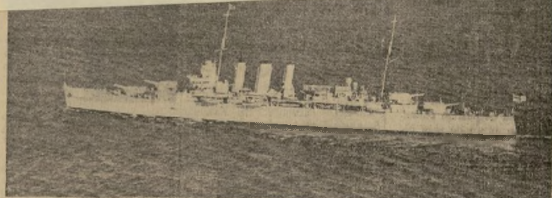
El peñón de Gibraltar y el crucero de la marina de guerra inglesa "Sussex", uno de los buques de la flota del Mediterráneo, visto desde un aeroplano de reconocimiento volando sobre la armada.