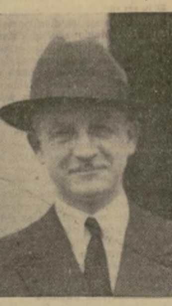
Ex-embajador Sumner Welles

Espérase que Mrs. Roosevelt visite la Rep. de Méjico