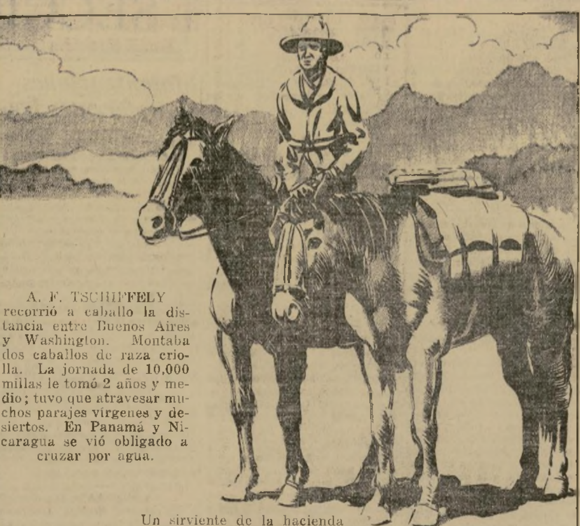
A. F. TSCHUFFELY recorrió a caballo la distancia entre Buenos Aires y Washington. Montaba los caballos de raza criolla. La jornada de 10,000 millas le tomó 2 años y medio; tuvo que atravesar muchos parajes virgenes y desiertos. En Panamá y Nicaragua se vio obligado a cruzar por agua.