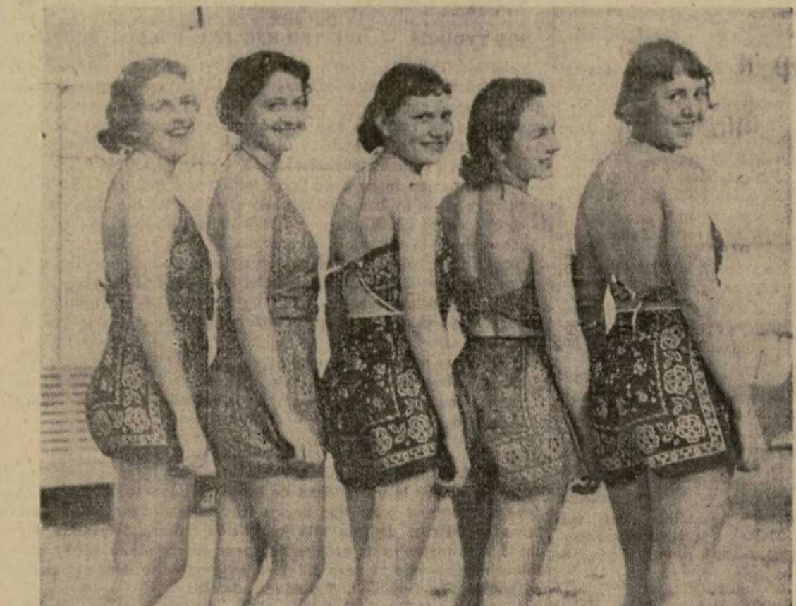
La última palabra en bañadores parece ser los confeccionados con pañuelo y medio; el entero para las calzonas y el medio para el corpiño, como se ve en los que usan estas cinco muchachas que están pasando una temporada en Santa Catalina, California.