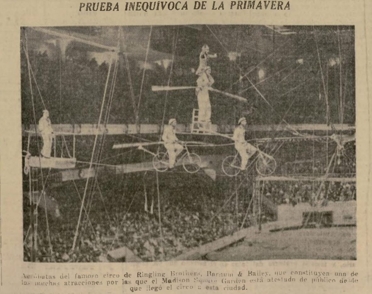
Acrobatas del famoso circo de Ringling Brothers, Barnum & Bailey, que constituyen una de las muchas atracciones que está alojado de público desde que llegó el circo a esta ciudad.

G. MEDIAVILLA 1420 - 5a. Avenida, Esq. 116 St. New York. Teléfono: University 4-4828