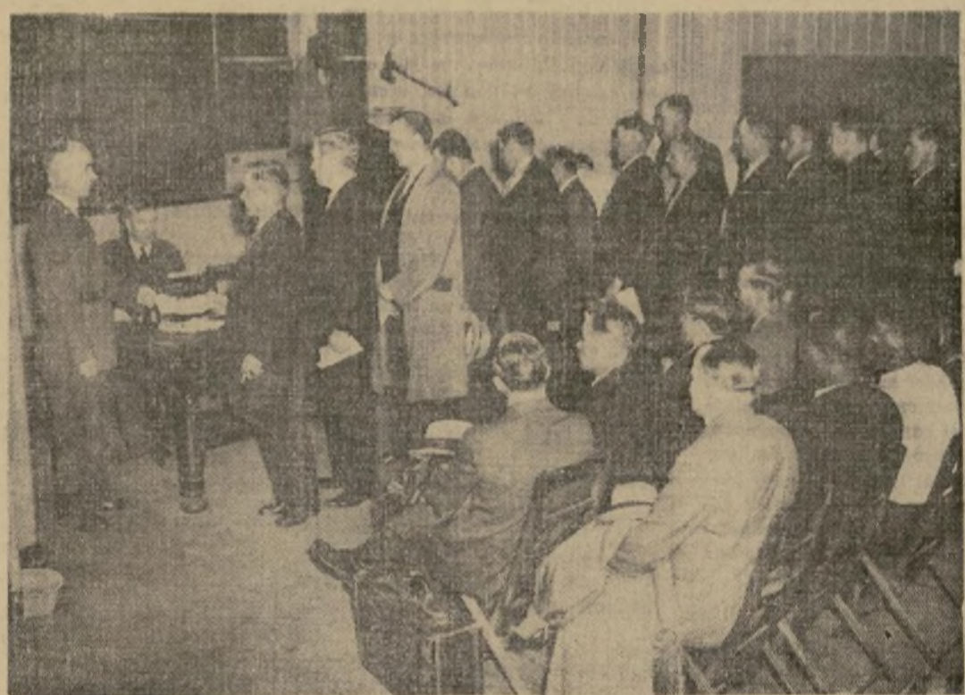
Nuevas inscripciones para el Campamento Civil de Conservación. Veteranos de la guerra, de Nueva York, New Jersey y Delaware muestran sus papeles en la oficina neoyorquina del CCC para inscribirse como solicitantes de las plazas dejadas por los hombres desocupados el 11 de marzo.

Fracasa también Mr. Caffery como Emb. S. Welles?