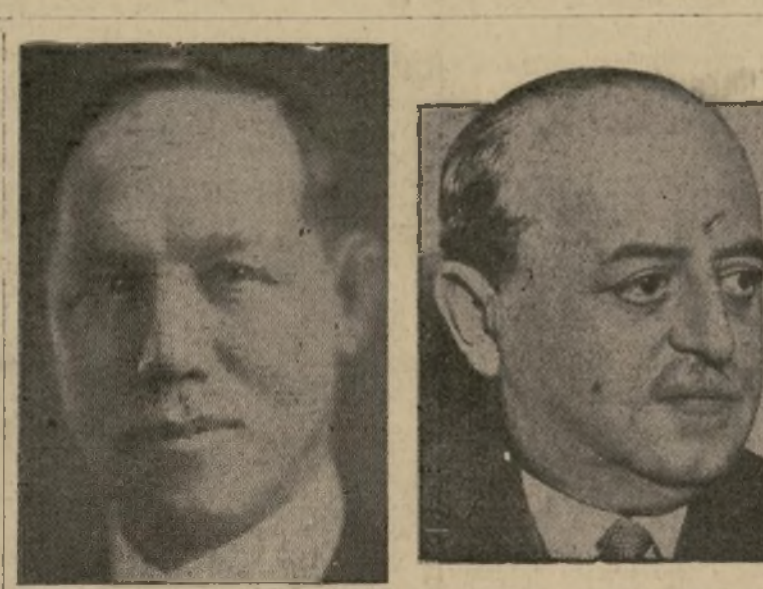
Presidente Enrique Olaya Herrera

Renunciaron sus plazas en el ejército americano para ir a aquella república