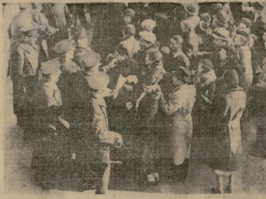
Candidatos a reclutas en el Cuerpo de Conservación Civil, muchos de los cuales se reincorporan, presentando sus solicitudes en el Edificio del Ejército. Los aceptados se envían en grupo a las cocinas militares y de allí, en autobuses, al campamento de Dix, N. J., donde reciben ropas e instrucción antes de salir para el campo.