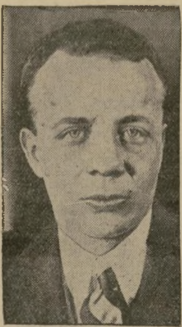
Mr. Theodore Roosevelt