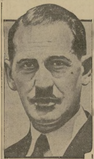
Ramón Grau San Martín ex presidente de Cuba

La promesa inmediata y radical de reformas en la organización nacional. Protección a la agricultura, sujeción del paro obrero, control del territorio en explotación.