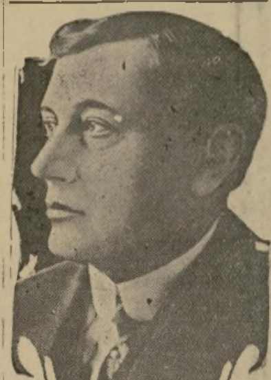
Arturo Alessandri, Pte. de Chile