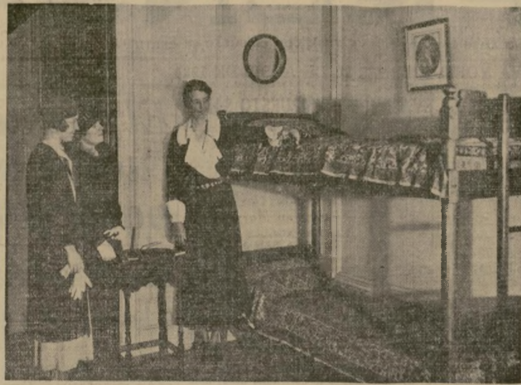
La esposa del presidente de los Estados Unidos, en su residencia de Nueva York, presidiendo la venta de muebles que se hizo en las tiendas Val-Kill de Hyde Park, construidos por los antiguos sistemas de ebanistería norteamericana. Mrs. Roosevelt firmó todos los muebles que vendió.