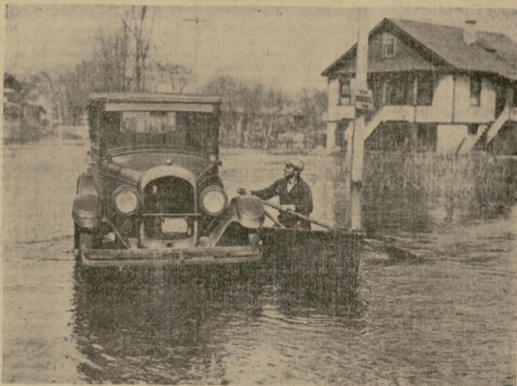
Un botero voluntario "atraca" a un automóvil que se había perdido en las afueras de Hartford, capital del Estado, al desbordarse el río Connecticut.

INUNDACIONES PRIMAVERALES EN CONNECTICUT