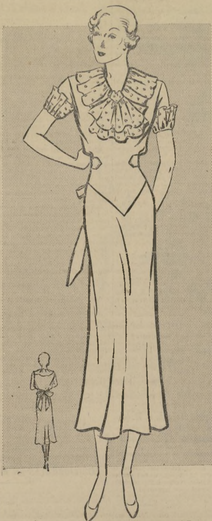
VESTIDO DE TARDE CON RIZADOS

1309-B. — Los vestidos de tarde, para los cuales hay gran demanda esta temporada, están también diseñados para usarse en la casa. En la mano parece como si fueran pequeñas piezas de seda fina, pero cuando se usan cambian de aspecto por completo, que tienen el suficiente vuelo, y los nuevos adornos rizados que tanto adornan y favorecen al cuerpo, quitándole la monotonía que tienen los trajes de diario. Un buen ejemplo de este tipo es el modelo que hoy ilustramos. Se observará que a pesar de lo sencillo que es, tiene lo suficiente para darle gracia a la figura. El adorno en la blusa es el único que este vestido lleva, siendo el resto completamente sencillo y fácil de confeccionar. Esta clase de traje es muy corriente en seda lisa, así como estampada, del mismo modo que puede hacerse en tejidos de algodón. El rizado generalmente se hace de material distinto y en diferente color. Puede conseguirse este patrón cortado en los tamaños 32, 34, 36, 38, 40 y 42. Para la talla 34 se necesitarán 3 y media yardas de material que tenga 39 pulgadas de ancho, y tres cuartos de yarda de material contrastante. El costo de este patrón es de $20. Solamente en los lugares especificados. Al ordenar cualquiera de estos patrones, envíenos claramente la medida exacta que se desea.