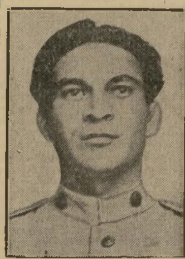
Coronel Fulgencio Batista

La huelga sigue firme. SANTIAGO DE CHILE, mayo 4 (P). — El Sindicato Único de Electricistas que se encuentra en huelga desde hace tres semanas, anunció hoy que había conseguido la adhesión de la Confederación General de Obreros de Imprenta, del Comité Unico de Construcción y de la Confederación de Sindicatos Industriales y varias organizaciones más. Entiéndese que los electricistas están tratando de