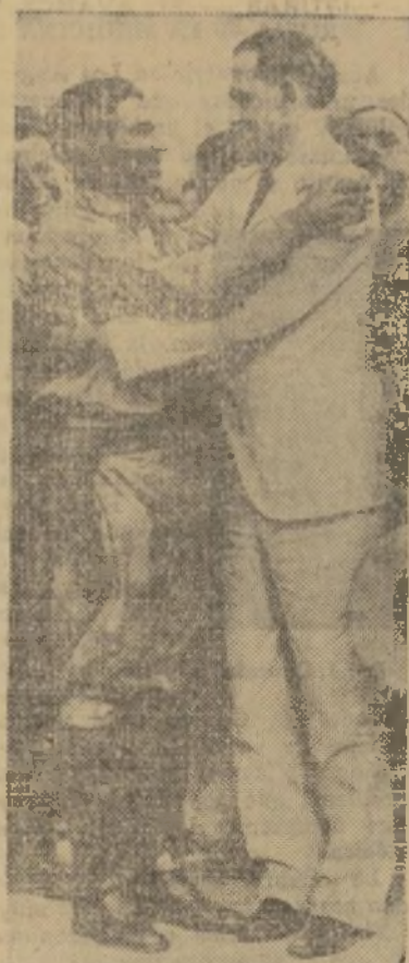
El coronel Batista en la época de su colaboración con el presidente Grau San Martín—a quien poco después derrocaba.

COHETES MORTÍFEROS ALEMANES CAUSAN EN FRANCIA GRAN TEMOR