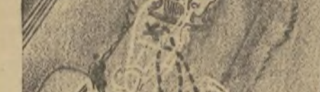
2. "Soldado acero en un arsenal, veo abundantes ejemplos del castigo a que se somete al acero. Y todo el mundo sabe que si los barcos de guerra no fueran de acero, hoy en día no resistirían la menor batalla en alta mar."