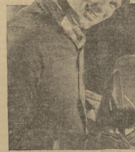
1. "Soldado acero en un arsenal, veo abundantes ejemplos del castigo a que se somete al acero. Y todo el mundo sabe que si los barcos de guerra no fueran de acero, hoy en día no resistirían la menor batalla en alta mar."

UNA ENTREVISTA CERTIFICADA CON M. E. MERRITT, ARSENAL, CHARLESTON, S. C.