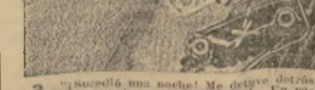
3. "Soldado acero en un arsenal, veo abundantes ejemplos del castigo a que se somete al acero. Y todo el mundo sabe que si los barcos de guerra no fueran de acero, hoy en día no resistirían la menor batalla en alta mar."