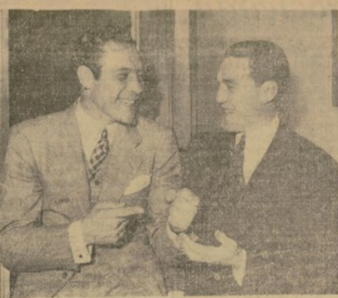
Max Baer (izquierda) y Tommy Loughran, que ya se ha visto frente a Carnera en el cuadrilátero, se encuentran en el Madison Square Garden para discutir los métodos que usa Carnera, mientras Baer se prepara a pelear con el campeón.