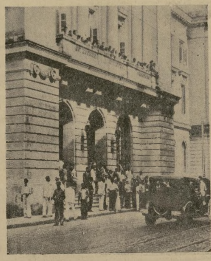
Los estudiantes abucheando a sus guardias, desde el pórtico y el balcón de la Escuela Superior de la Habana, después del motin en que resultó uno de los alumnos muerto y 16 heridos.

Mendieta dispuesto a "dar un golpe de barra hacia la derecha".—Cuba no está preparada para la democracia.—Los estu- diantes protestan contra "la dictadura militar de Batista".—Tres puerto- rriqueños evadense de la prisión habanera.