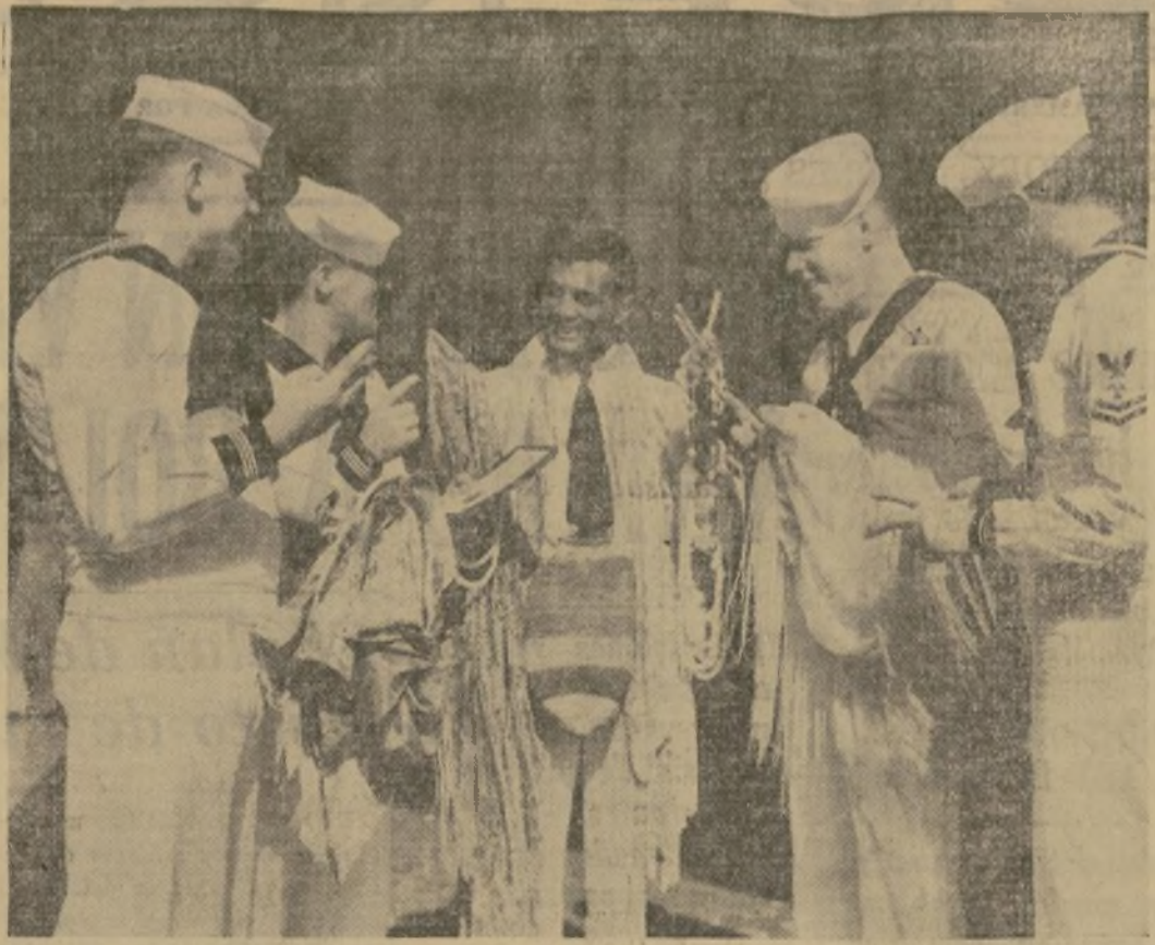
Marineros de la escuadra norteamericana, regateando antes de adquirir mantones, bolsos indios y joyas de un vendedor ambulante en Colón, cuando pasó la flota por el Canal.