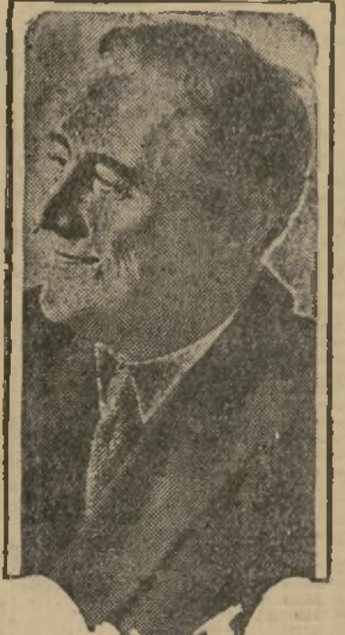
Pdte. Franklin D. Roosevelt

Entre la expectativa de la colonia gallega de aquí, que se está preparando para organizar un recibimiento digno de su fuerza y del mérito de los artistas que llegarán, se aproxima ya la llegada de los famosos coros gallegos denominados "Anaquinos d'a Terra". La comisión organizadora de Nueva York ha recibido ya respuesta—según nos informa el señor Marco—al cablegrama de saludo que se envió a España.