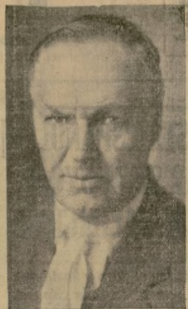
Clarence Darrow, miembro de la Junta Nacional de Resurgimiento, cuyo informe condenando la dirección adoptada en los códigos de la NRA ha sido calificado por el general Johnson de "superficial, inmoderado e inexacto."