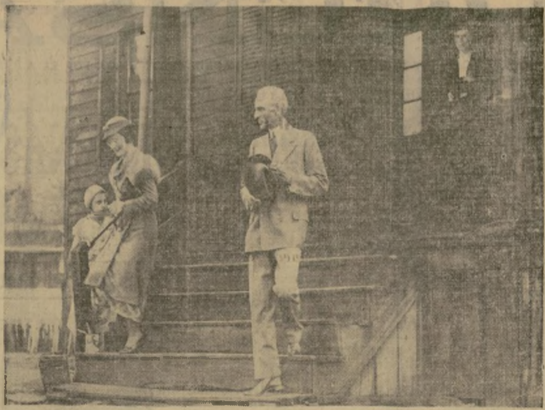
El magnate, al salir de la casa de Pittsburgh donde nació Stephen Collins y que transportará su dueño a Greenfield Village, cerca de Dearborn, Michigan, como última adición a su extensa colección de antigüedades americanas.