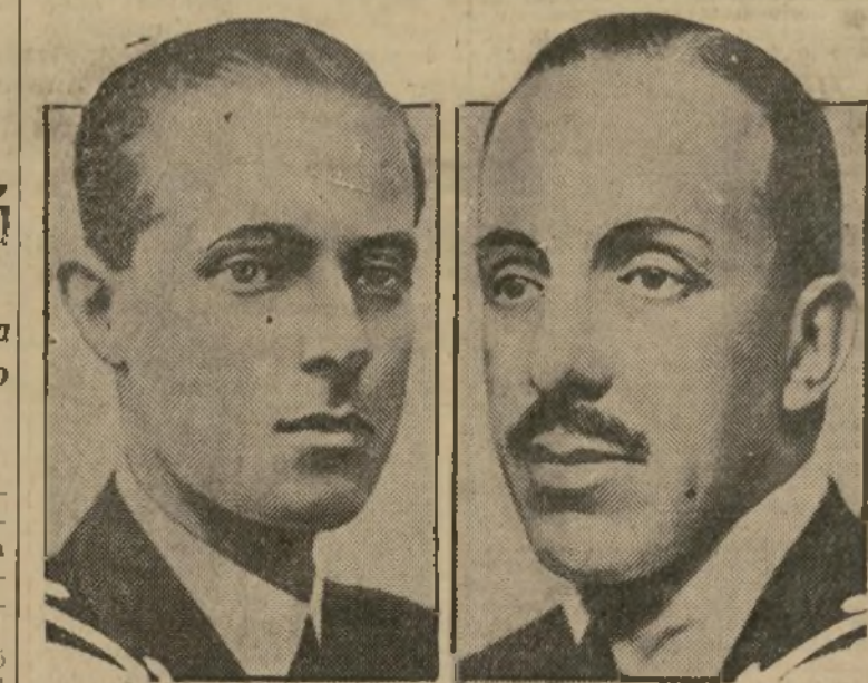
Ex Príncipe de Asturias. Don Alfonso de Borbón

EL CALOR LLEGÓ OTRA VEZ A LOS 86 GRADOS AYER