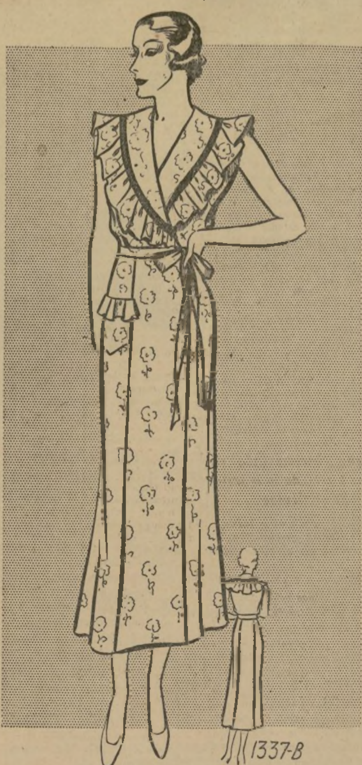
VESTIDO DE CASA PARA EL VERANO

Para hacer una loción cuba-... extiéndese de nuevo