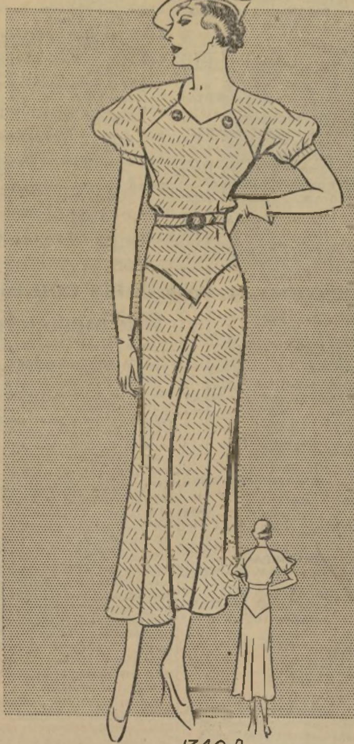
1340-B VESTIDO DE CALLE PARA EL VERANO

1340-B. — Los vestidos de campo y ciudad para este año están confeccionados con mucha simplicidad, son de un estilo muy conservativo, sin señalar definitivamente ningún tipo.