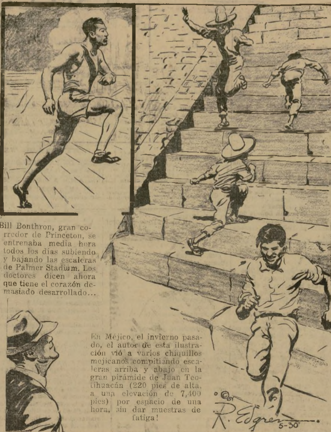
En México, el invierno pasado, el autor de esta ilustración vio a varios chiquillos mejicanos compitiendo escaleras arriba y abajo en la gran pirámide de Juan Teotihuacán (220 pies de alta, a una elevación de 7,400 pies) por espacio de una hora, sin dar muestras de fatiga!