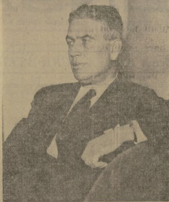
Estudio íntimo del profesor Rexford C. Tugwell, considerado generalmente como el primer personaje del ya famoso "Comité de Sabios" o "Brain Trust" de Mr. Roosevelt. Tugwell ha sido nombrado Subsecretario de Agricultura por el Presidente en Kansas City, Mo.