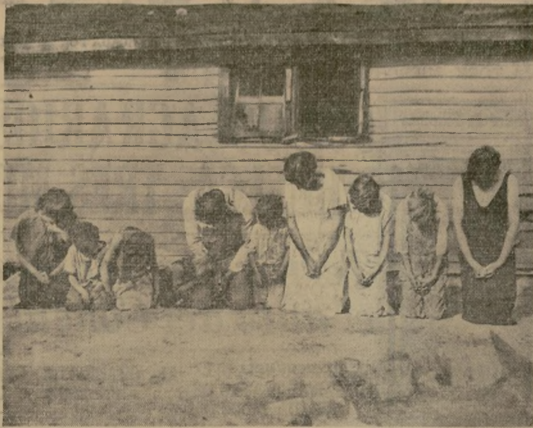
Todos los miembros de la familia de un colono de Menominee, Wisconsin, arrodillados delante de su casa, ruegan a la Providencia que les conceda la lluvia bienhechora y termine con la sequía que tantos daños está causando en el centro Oeste del país, en donde el ganado se muere de hambre por falta de pastos mientras el sol abrasador achicharra los trigales.