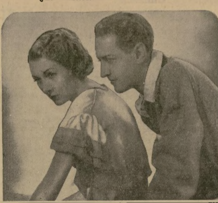
Haciendo un diagnóstico de los románticos devaneos de la bella Karen Morley, el "Doctor" Otto Kruger prepara sus diabólicos planes así en "The Crime Doctor" ahora en Regent y Hamilton.