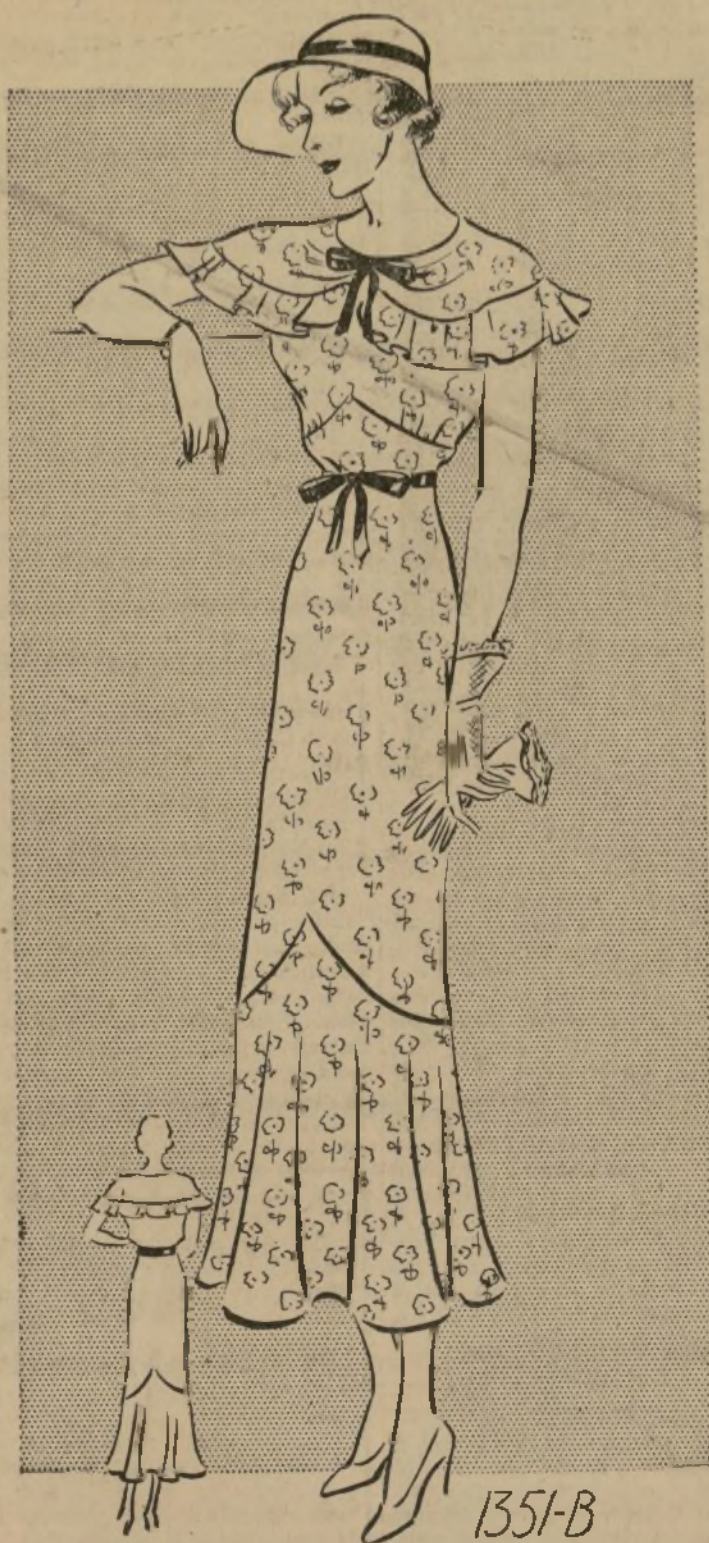
VESTIDO DE TARDE

1351-B. — Si usted es una de las muchas damas que vislumbran con placer el retorno de las telas de algodón para la confección de trajes, es seguro que ha de mirar con agrado la vuelta de la moda de los vuelos y voladitos en estos. Naturalmente, este adorno es el único que le da mayor nota de elegancia a nuestras telas nativas. Los modistos americanos tratan de conseguir por medio de libros antiguos de Charleston y New Orleans, detalles para la confección de estos trajes, porque el Sur siempre tuvo la fama de las modas de vestidos de algodón. El modelo que ilustramos hoy es de fustán, con figuritas de varios colores en fondo blanco. Esta tela no encoge ni pierde el color y lava muy bien. Si prefiere