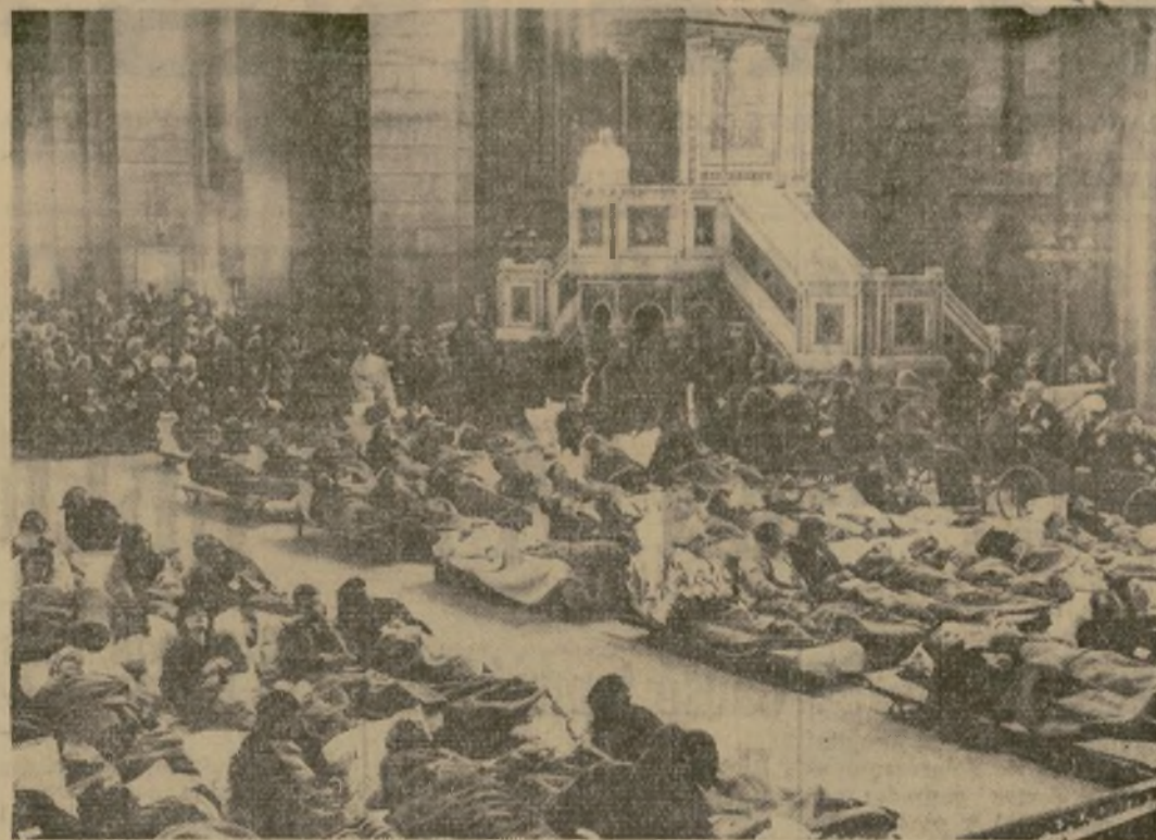
Los fieles, traídos al templo en camillas, oyen la misa que se celebra todos los años en la Iglesia del Sagrado Corazón, en las alturas de Montmartre, en París.