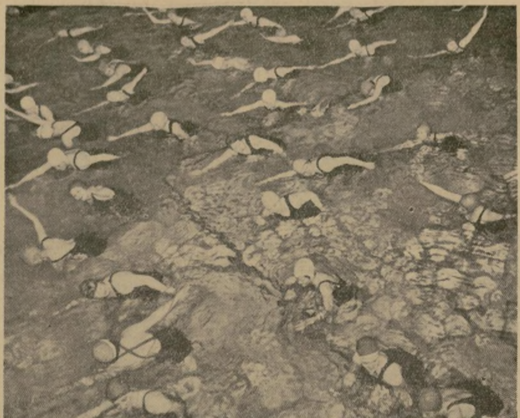
Una sección de instrucción del "Crystal Pool" de Seattle, Washington, donde dos veces a la semana se da clases gratuitas de natación a hombres y mujeres bajo los auspicios de la Junta de Parques. La Junta opina que cada nuevo nadador es un ahogado menos.