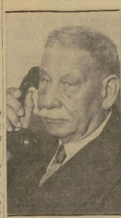
Dr. Domingo Méndez Capote

En los círculos cubanos de esta ciudad se ha recibido con profunda consternación la noticia del fallecimiento, ocurrido en la Habana el sábado, del Dr. Domingo