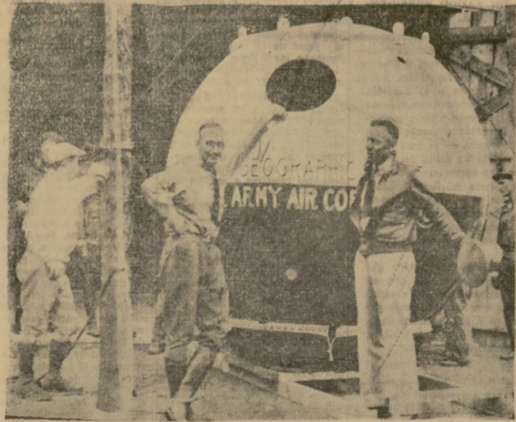
El capitán A. W. Stevens (en el centro) quien, acompañado del comandante William Kepner, trató de hacer otra ascensión de altura desde Rapid City, South Dakota, durante este mes, examinando la baquilla del globo después que llegó esta al lugar de la ascensión. La excursión se hará bajo los auspicios del ejército de los EE. UU. y la Sociedad Geográfica Nacional.

PREPARATIVOS DE ASCENSIÓN A LA ESTRATÓSFERA