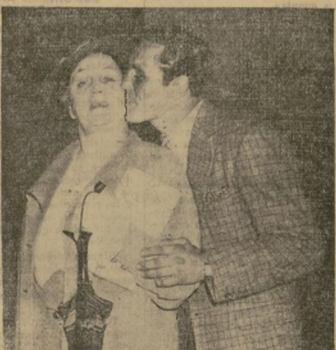
Max Baer, nuevo campeón mundial de boxeo, besando a su madre a la llegada de esta a la estación de Pennsylvania, procedente de su residencia en California.