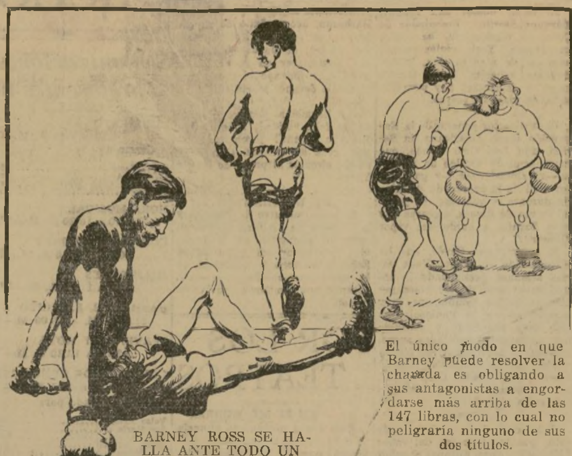
BARNEY ROSS SE HALLA ANTE TODO UN PROBLEMA...

Si no quiere poner en peligro su campeonato "lightweight" y obliga a sus contrarios a pelear sobre las 135 lbs. pondrá en riesgo automáticamente su campeonato "welterweight".