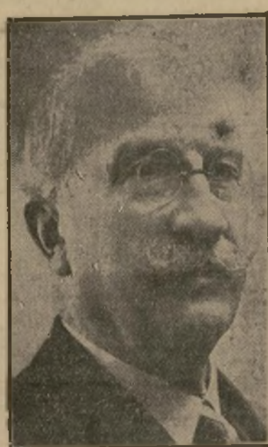
Don Alejandro Lerroux