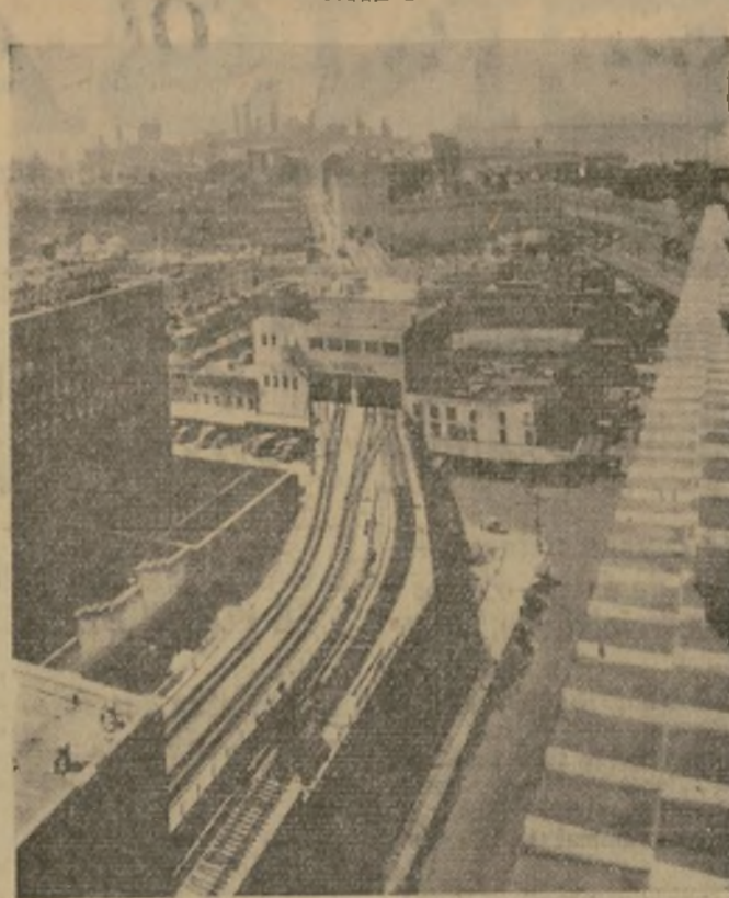
En el grabado se ve una sección de las líneas férreas proyectadas para el transporte de flete que acaba de construir la New York Central Railroad en el lado Oeste de la ciudad. En el se ven las vías que atraviesan un almacén de carnes.