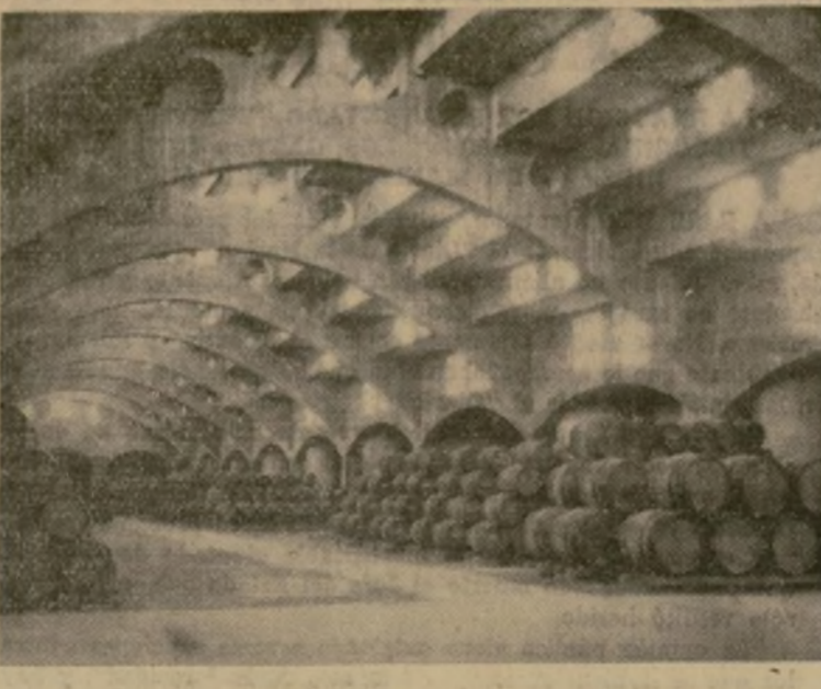
El vino se conserva un año en barricas de roble especial de Trieste.